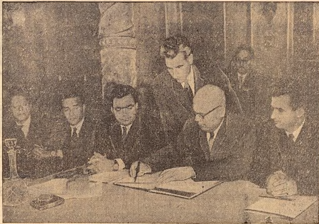
Tovarășul Chivu Stoica la Moscova, Declarația Consfăturii partidelor comuniste și muncitorești din țările socialiste.