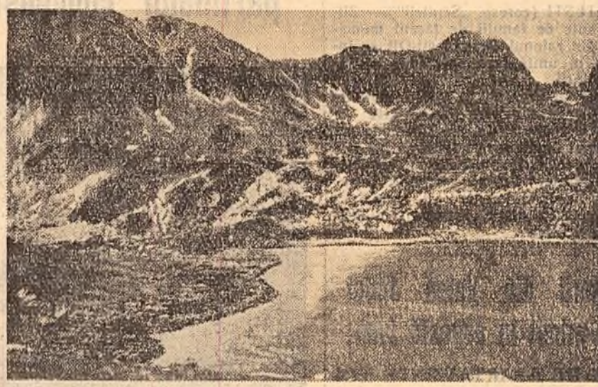
Frumusețea patriei. Lacul Bucura din Munții Retezat.