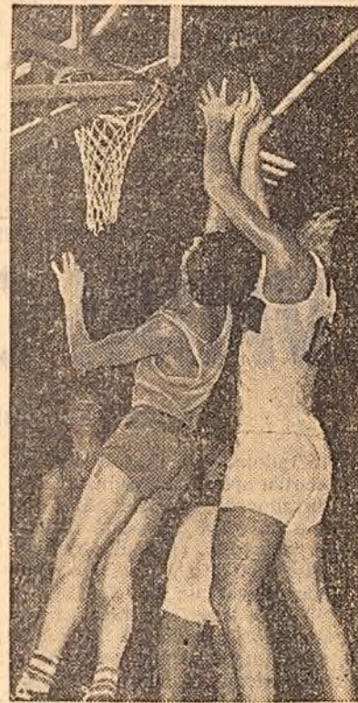
O fază spectaculoasă sub panou în meciul de baschet România — Turcia (citiți în pagina II-a rubrica de sport)