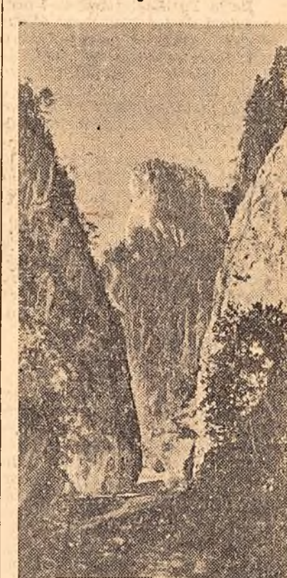
Vedere din Cheile Bicazului. În centrul fotografiei, „Piatra Altarului”