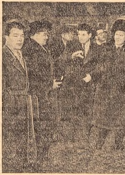
Delegația parlamentară romînă vizitînd capitala R. P. Polone, Varșovia