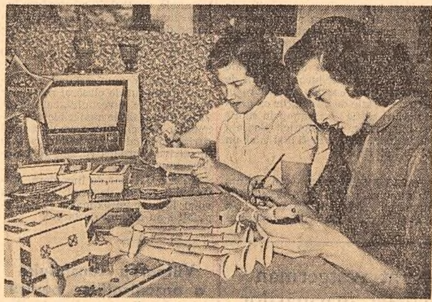
La cooperativa de artă populară din Tg. Mureș