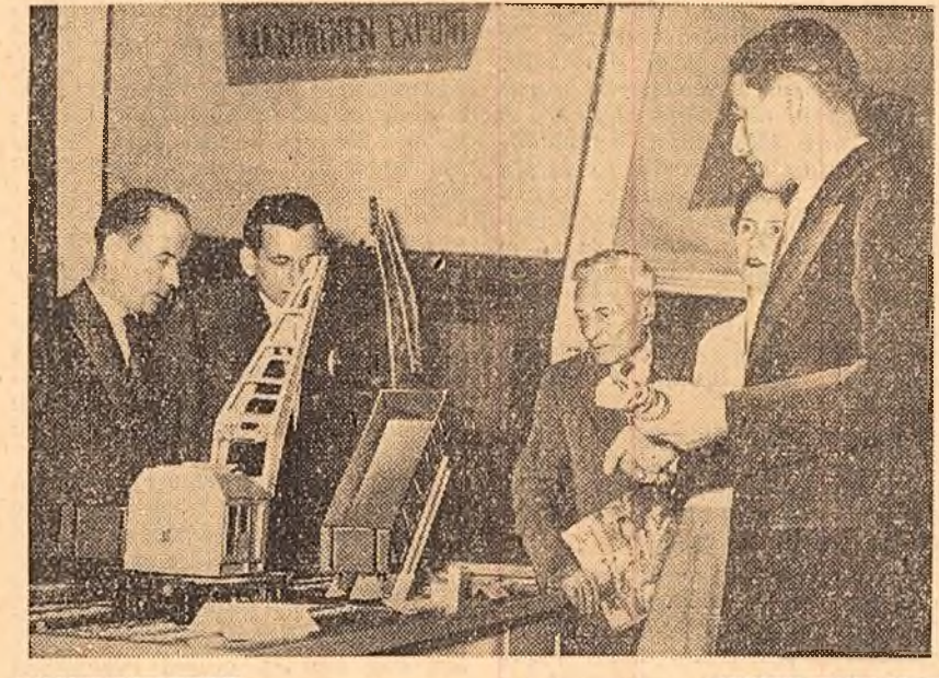
Joi la amiaza a avut loc deschiderea expoziției de machete a unor produse ale industriei constructorilor de mașini a R. D. Germane. În clișeu: Machetele utilajelor și mașinilor aflate la expoziție sint cercetate cu interes de vizitatori

HUNEDOARA (cosp. „Scintei”). — Așa cum s-a anunțat în presă, la 6 noiembrie constructorii Trusului 21 Instalații au terminat magistrața de gaz metan. Ardealul vest pînă la Simeria Veche. Ieri s-a încheiat o nouă etapă a construcției magistraței: terminîndu-se lucrările de racordare a conductei cu Hunedoara, a reglare pînă la termocentrala nr. 1 a Hunedoarei. Datorită eforturilor depuse de constructorii, termocentrala va începe să dea, în luna aceasta, energie electrică. Acum se lucrează și se va termina în aceste zile, gaz metan.