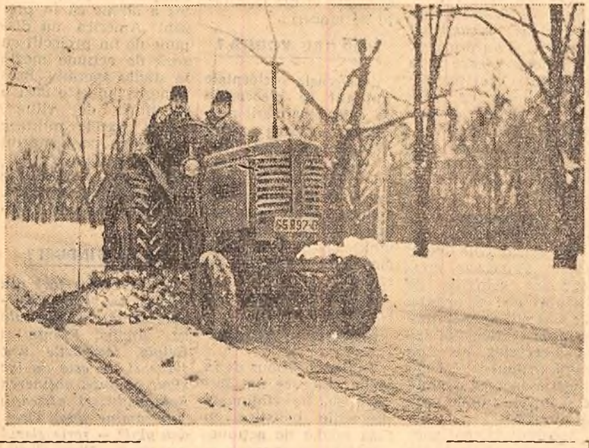
Odată cu căderea primei zăpezi pe străzile Capitalei au apărut... și plugurile. După cum se vede din fotografie, de data aceasta nu e vorba de un plug obișnuit, ci de un tractor K.D. prevăzut cu o mărură specială din sîrmă pentru măturarea zăpezii. În câșteu: Pe șoseaua Kiseleț, tractorul adaptat curățării zăpezii a și intrat în funcțiune.

La ultima fază (pe țară) se vor acorda premii și mențiuni în obiecte. De asemenea, C.C. al U.T.M. va acordă participanților la concurs insigna „Micul tehnician”.