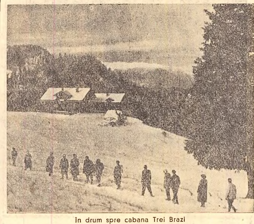
In drum spre cabana Trei Brazi

Constatarea va constitui un prilej de analizare a stadiului introducerii tehnicii noi în sectoarele textile, pielărie, cauciuc, sticlă. La constatare vor participa circa 800 ingineri și tehnicieni din întreaga țară, din in-