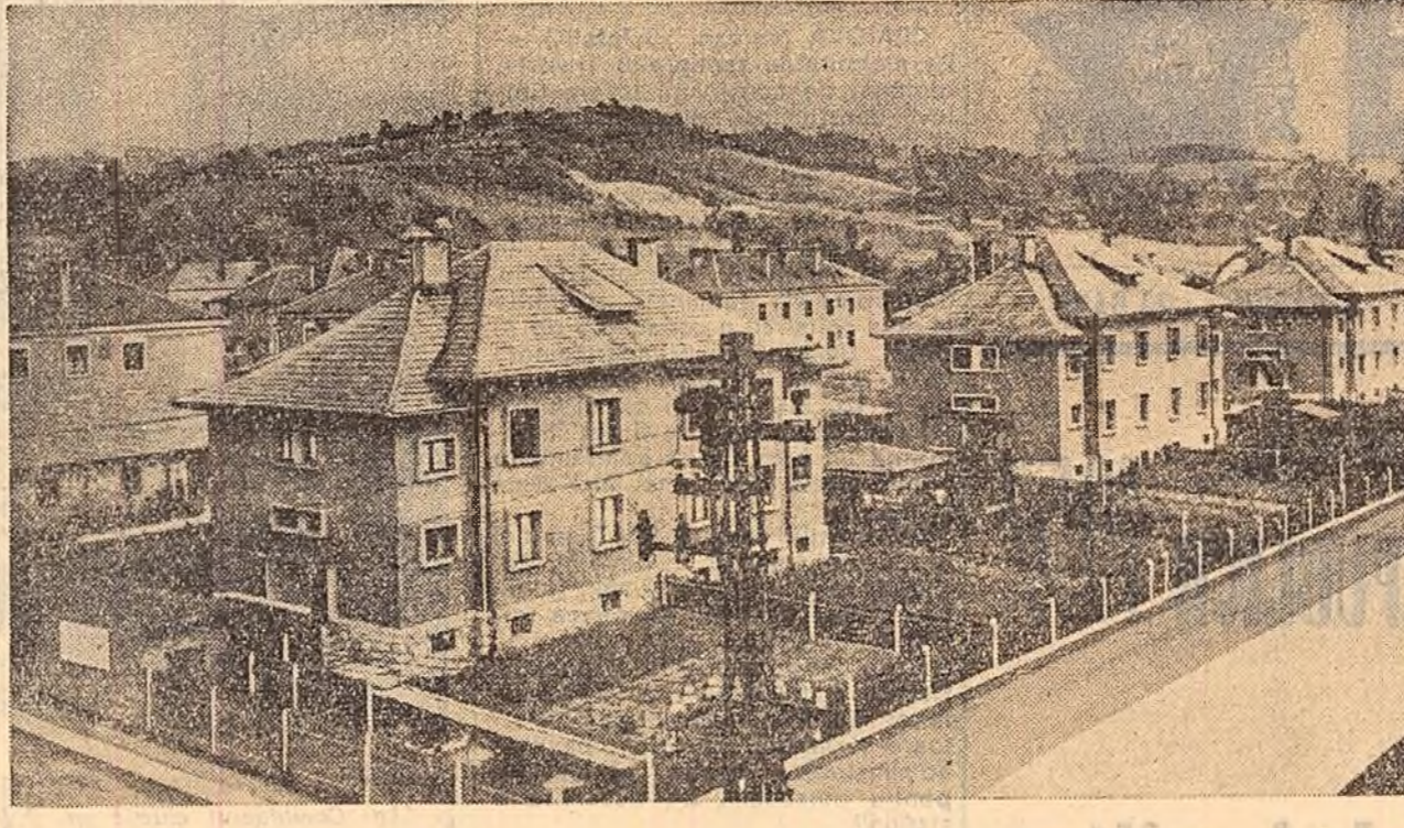
Petroșani. Vedere generală din cartierul Livezeni