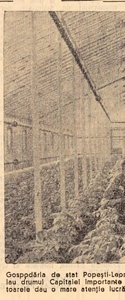
Gospodăria de stat Popești-Leordeni, regiunea București, are o mare suprafață ocupată cu seră. De aici drumul Capitalei importante cantități de legume timpurii. În serele în care se cultivă roși, muncitoarele dau o mare atenție lucrărilor de îngrijire a răsădului care a fost plantat nu de multă vreme.