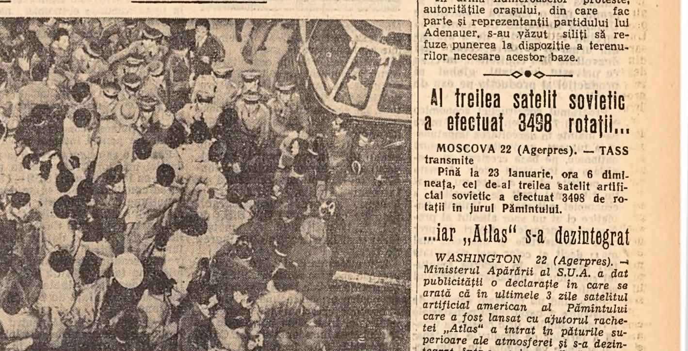
3000 de muncitori ai uzinei de aparate optice „Galileo” din Florența (Italia) au declarat grevă și au ocupat uzina pentru a împiedica astfel patronii să facă concedieri în masă. In fotografie: ciocniri între muncitorii greviști și poliști.

MOSCOVA 22 (Agerpres). — TASS transmite: Pină la 23 ianuarie, ora 6 dimineața, cel de-al treilea satelit artificial sovietic a efectuat 3498 de rotații în jurul Pământului. „Iar „Atlas” s-a dezintegrat WASHINGTON 22 (Agerpres). — Ministerul Apărării al S.U.A. a dat publicității o declarație în care se arată că în ultimele 3 zile satelitul artificial american al Pământului care a fost lansat cu ajutorul rachetei „Atlas” a intrat în paturile superioare ale atmosferei și s-a dezintegrat într-o regiune aflată deasupra Oceanului Pacific. Satelitul s-a stabilit pe orbită la 19 decembrie anul trecut. In cursul existenței sale de o lună și a înconjurat Pământul doar de 500 de ori.