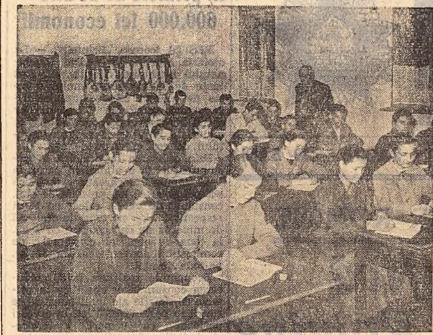
Elevii școlii pedagogice din Sighet cu limba de predare ucraineană, în timpul unei ore de curs.

Puteam noi obține recolte și venim mult mai mari dacă inundațiile din primăvară și seceta din vară nu ne-ar fi drămuțat în recoltă. Pentru a scăpa însă de inundații, colectivității noastre au sînat canale de desecare pe o lungime de 17,5 km. Rezultatele gospodăriei colective și veniturile colectivității au fost pe larg popularizate de către orga-