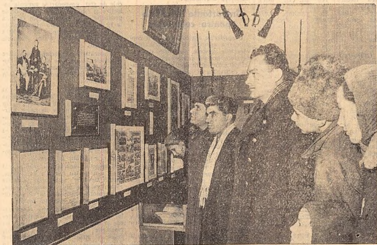
Un grup de vizitatori prin sălile expoziției „Centenarul Unirii Țărilor Romîne”, deschisă ieri în localul Muzeului Militar Central din Capitală

de noi modele de încălțăminte la 9 fabrici din țară printre care „Ianos Herbak” din Cluj, „Kirov” și „Flacăra Roșie” din Capitală, „Nikos Beloiian” din Timișoara și altele. Se preconizează de asemenea elaborarea la fabrica „Libertatea” din Arad a noilor modele de calapode pentru încălțămîntul de femei, bărbați și copii.