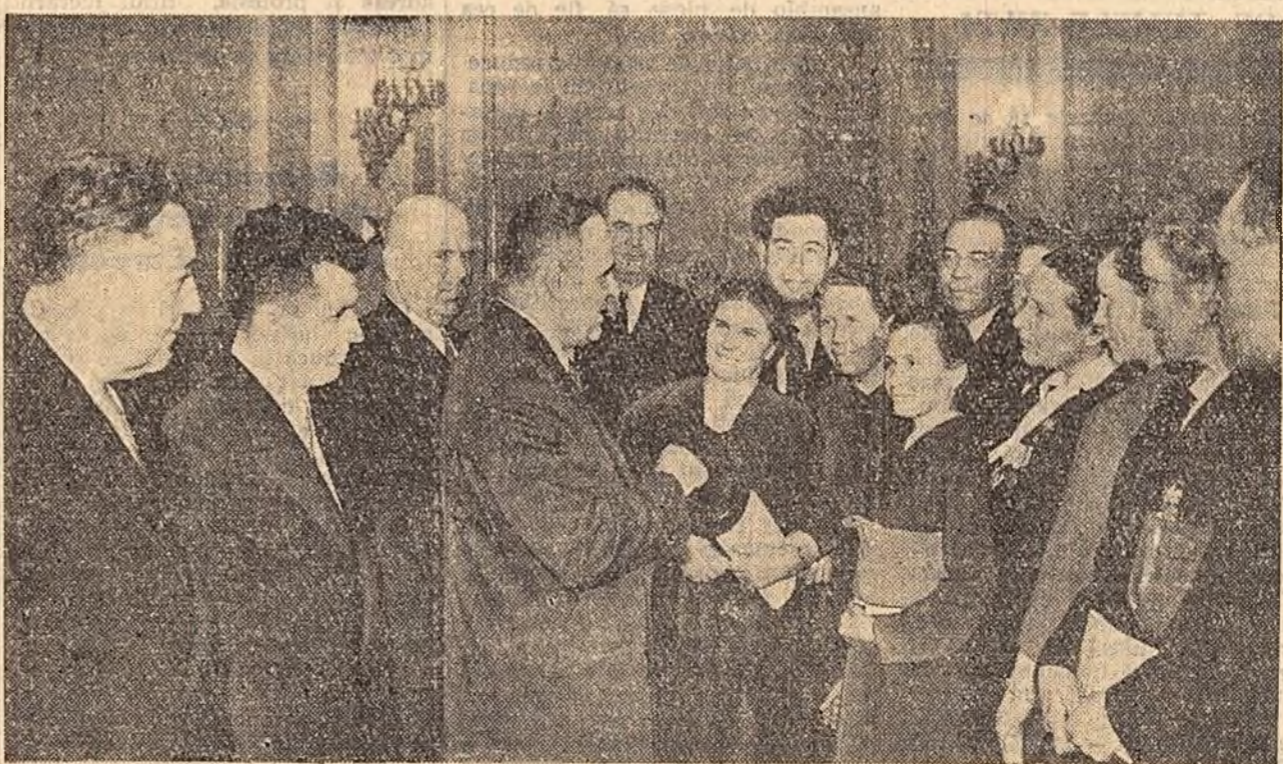
Membrii ai delegației Partidului Muncitoresc Romîn, în frunte cu tovarășul Gheorghe Gheorghiu-Dej, discută cu delegații la congres în Marele Palat al Kremlinului.

Expoziția de artă plastică a țărilor socialiste a fost vizitată în cursul zilei de delegația Partidului Muncitoresc Romîn, în frunte cu tovarășul Gheorghe Gheorghiu-Dej. In cartea de înregistrare a expoziției, delegația a notat printre altele: „Expoziția de artă plastică a țărilor socialiste este vizitată cu un urias interes. Dorim artiștilor din țările socialiste succese în dezvoltarea artei realiste, pusă în slujba poporului”.