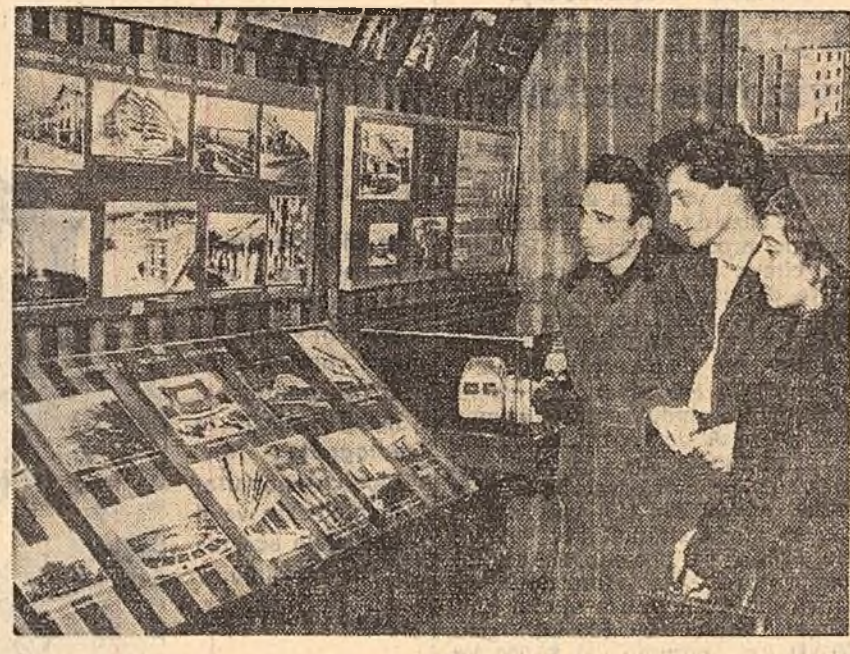
Muzeul de istorie al orașului București este vizitat cu mult interes de cetățenii Capitalei.

Dezbaterile care au avut loc în cadrul consfătuirilor de contribuție la îmbunătățirea muncii politice și culturale de masă, la transparența în viața a marilor obiective trasate de plenara C.C. al P.M.R. din noiembrie 1958.