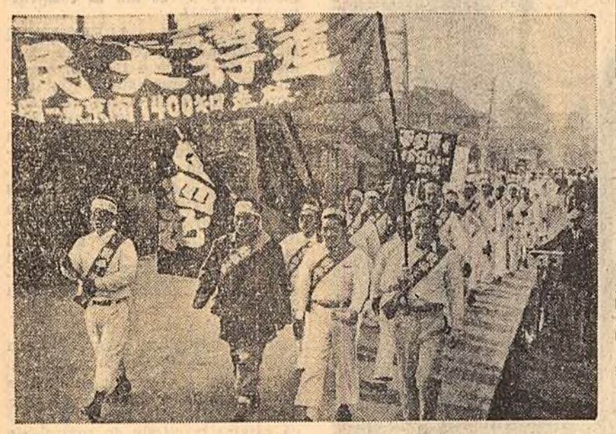
Muncitorii din orașul Omuta au pornit un marș popular de 1.400 km. spre Tokio, pentru a protesta împotriva șomajului și pregătirilor de război...