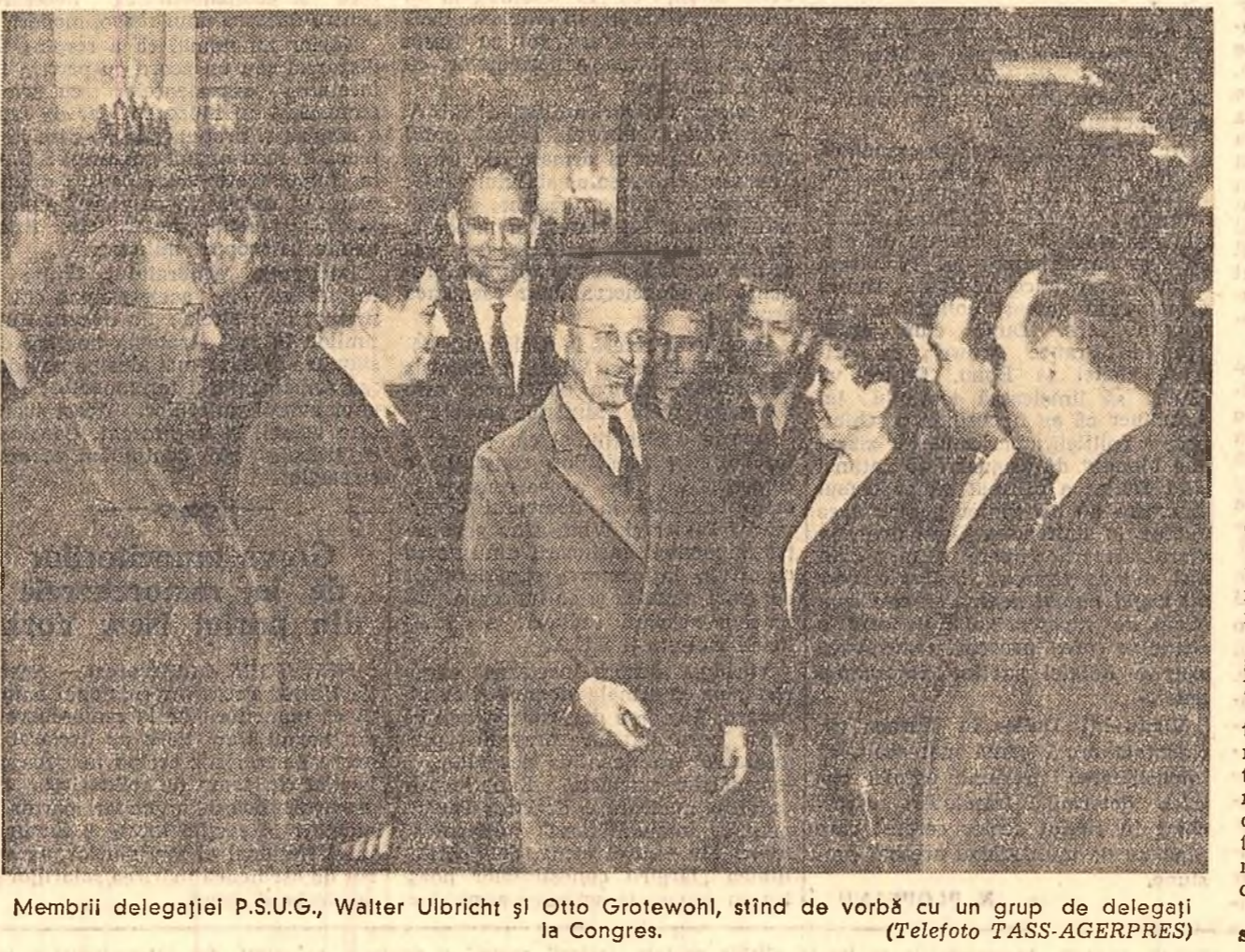
Membrii delegației P.S.U.G., Walter Ulbricht și Otto Grotewohl, stînd de vorbă cu un grup de delegați la Congres.

La 5 februarie Congresul își continuă lucrările.