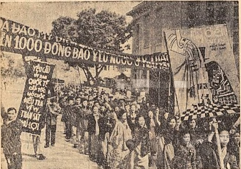
Poporul vietnamez condamnă cu indignare crima săvârșită de marionetele imperialiștilor americani din Vietnamul de sud, care au otrăvit o mlaie de defunzi politici în lagărul de la Fu Loi. În clipșu, demonstrația de protest a două mii de femei din Hanoi.

lor muncii din agricultură a adresat muncitorilor agricoli și dijmașilor un apel în care se spune printre altele: „În prezent în sate se resimt urmările catastrofale ale politicilor autorităților guvernamentale și care a luat o formă deosebit de gravă după lătrăria în vigoare a acordului cu privirea la „piața comună”.