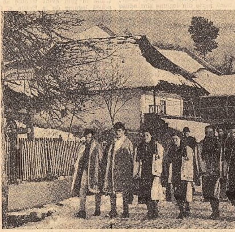
La poalele munților Carpați, pe rîul Luncaș, se află comuna Valdean (regiunea Pitești), al cărui nume este legat de viața grea din trecut a țăranilor muncitori. În anii regimului democrat-popular s-au petrecut mari prefaceri și în această comună. Printre altele, aici se desfășoară o bogată activitate culturală, la care luă parte numeroși țăranii muncitori. Iată-l pe localnicul, pornind într-o zi de sărbătoare spre cîminul cultural.

La poalele munților Carpați, pe rîul Luncaș, se află comuna Valdean (regiunea Pitești), al cărui nume este legat de viața grea din trecut a țăranilor muncitori. În anii regimului democrat-popular s-au petrecut mari prefaceri și în această comună. Printre altele, aici se desfășoară o bogată activitate culturală, la care luă parte numeroși țăranii muncitori. Iată-l pe localnicul, pornind într-o zi de sărbătoare spre cîminul cultural.