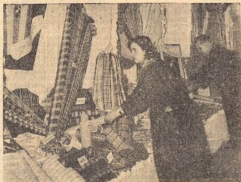
Cîteva din numeroasele articole de lînă și bumbac — produse ale mai multor întreprinderi textile din țară — expuse în cadrul unei expoziții organizată recent la „Industria Bumbacului A” din Capitală în vederea încheierii de contracte între comerț și industrie pe anul 1959.