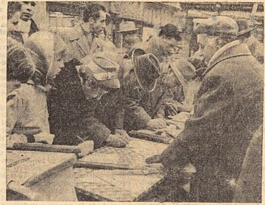
Mii de locuitori din Germania occidentală au semnat petiții către Bundestag prin care protestează împotriva înzestrării Bundeswehrului cu arme atomice.

PARIS 7 (Agerpres). — După încheierea tratativelor pe care secretarul de stat al S.U.A., Dulles, le-a dus la Paris cu ministrul Afacerilor Externe al Franței, Couve de Murville, și președintele De Gaulle, nu a fost dat publicității nici un cuvînt oficial. Un purtător de cuvînt al Ministerului Afacerilor Externe al Franței a declarat că în cursul tratativelor pe care Dulles le-a dus cu conducătorii Franței s-a ajuns, în principiu, la un acord asupra planului convocării unei conferințe a ministrilor Afacerilor Externe ai celor patru puteri. Purtătorul de cuvînt al Ministerului Afacerilor Externe al Franței a declarat că în cursul tratativelor pe care Dulles le-a dus cu conducătorii Franței s-a ajuns, în principiu, la un acord asupra planului convocării unei conferințe a ministrilor Afacerilor Externe ai celor patru puteri.