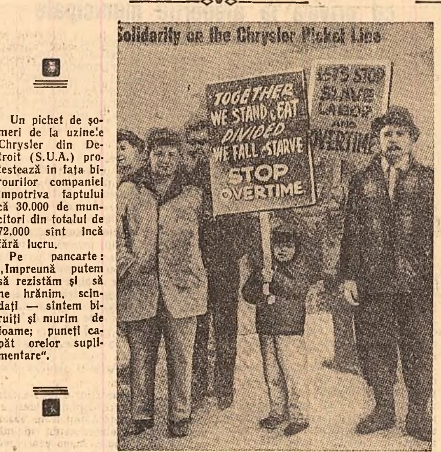
Spicuirii din presa occidentală

„Din nefericire pentru conducătorii turci — se spune în articol — acest devotament aproape orb față de cauza atlantică nu a dat deloc roade... Militarizarea excesivă a Tur-