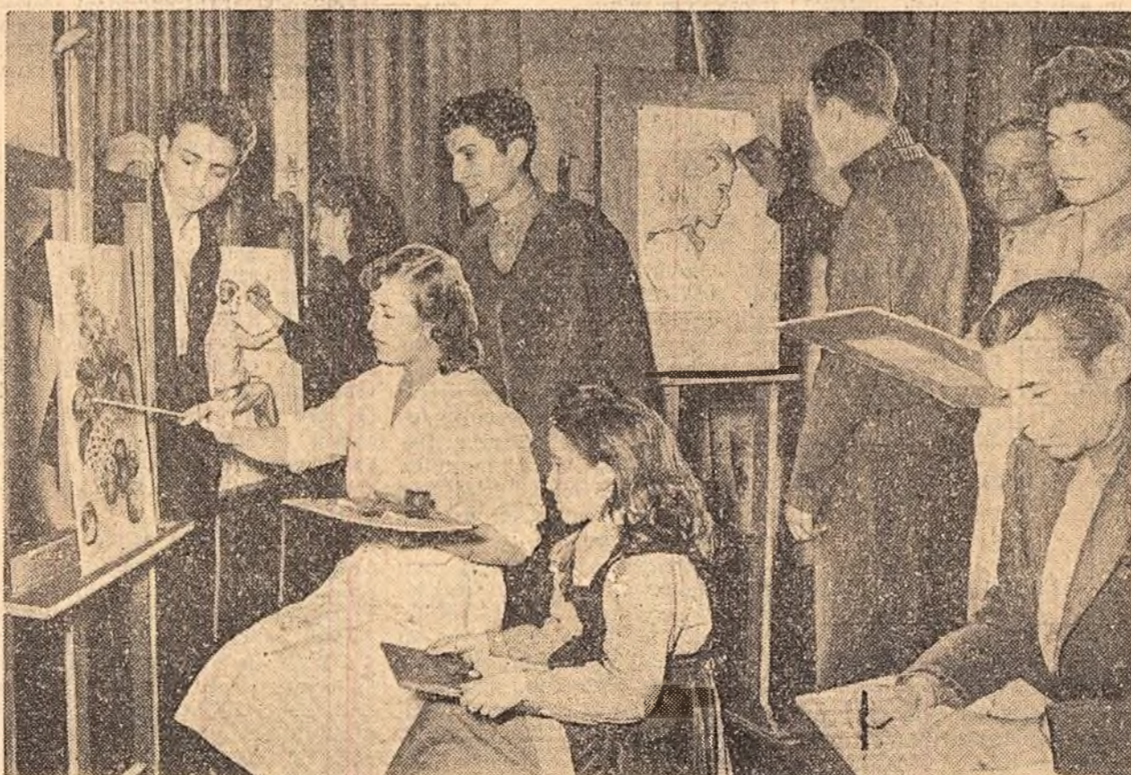
La Casa de Cultură a Combinatului metalurgic de la Reșița activează peste 1.100 muncitori în cadrul diferitelor cercuri de artiști amatori. Iată un aspect de la cercul de artă plastică.