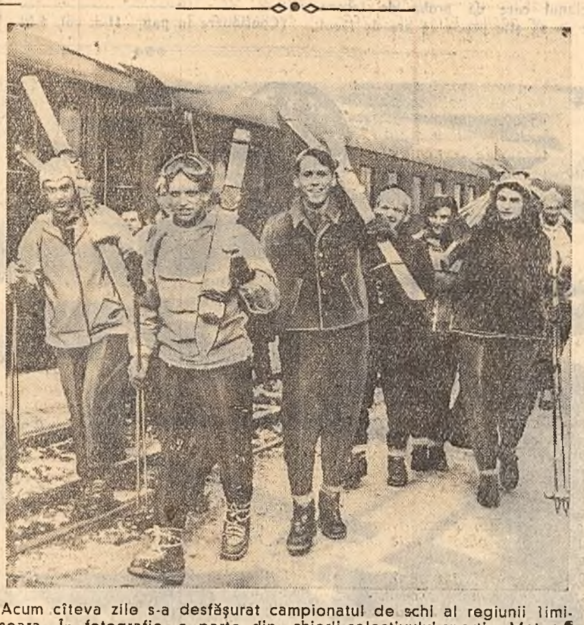
Acum cîteva zile s-a desfășurat campionatul de schi al regiunii Iimșoara. În fotografie, o parte din schiorii colectivului sportiv „Meteo” din Timișoara, în drum spre muntele Semenic.