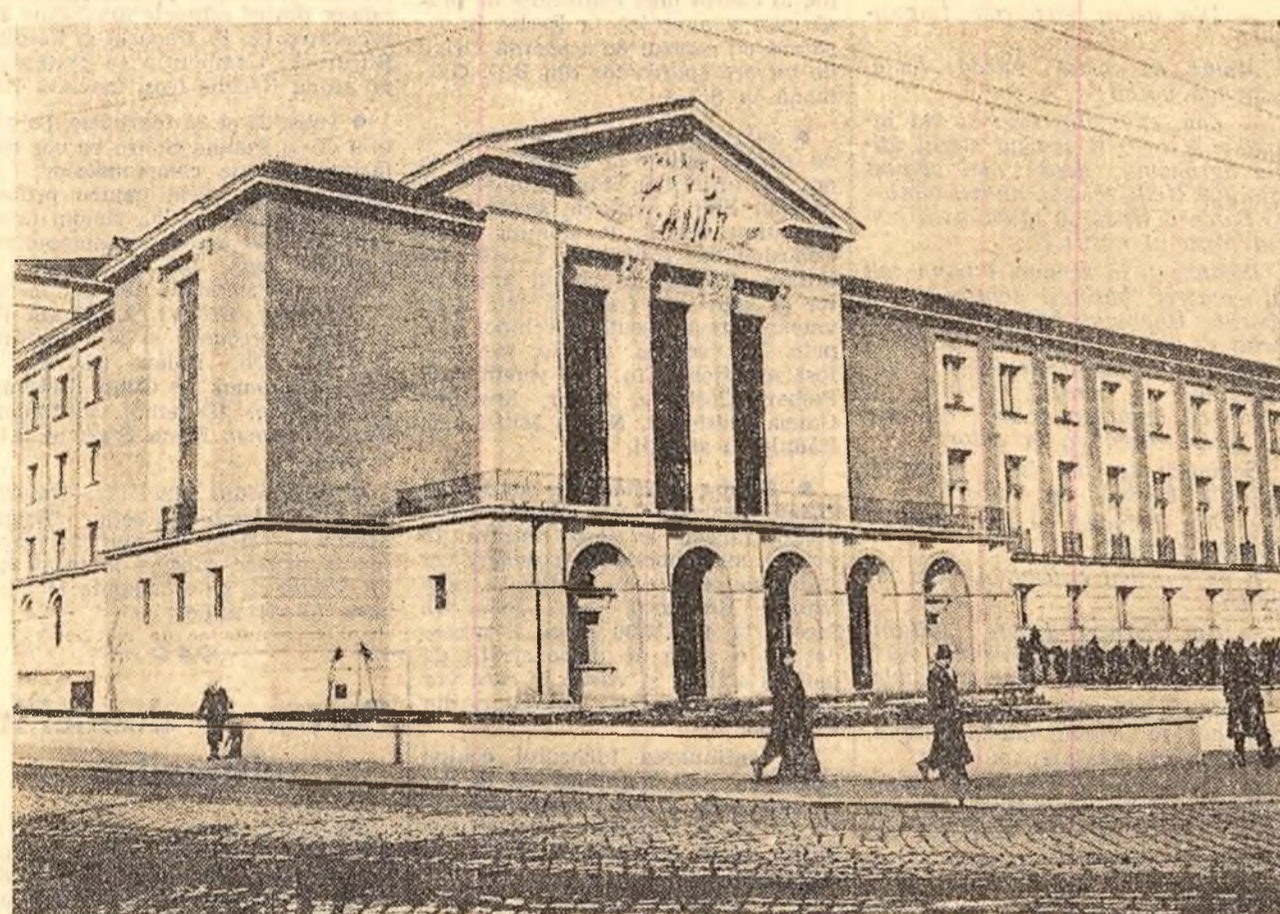
La Reșița s-a construit o frumoasă casă de cultură a combinatului metalurgic, care este dotată cu săli spațioase pentru bibliotecă și pentru diferite cercuri, o sală de cinema, iar la sfîrșitul anului se va da în folosință și o sală modernă de teatru. În fotografie: aspect exterior al casei de cultură.

Simt stofa aspră, școlărească, Simt gîtul fraged, de bălat. Ca el să fie, să trăiască, S-a stîns, al ei, la Stalingrad.