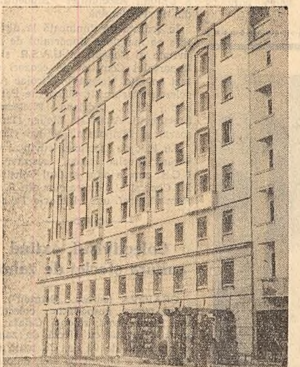
Clădirea noului cămin al ceferiştilor, construită anul trecut în Capitală.