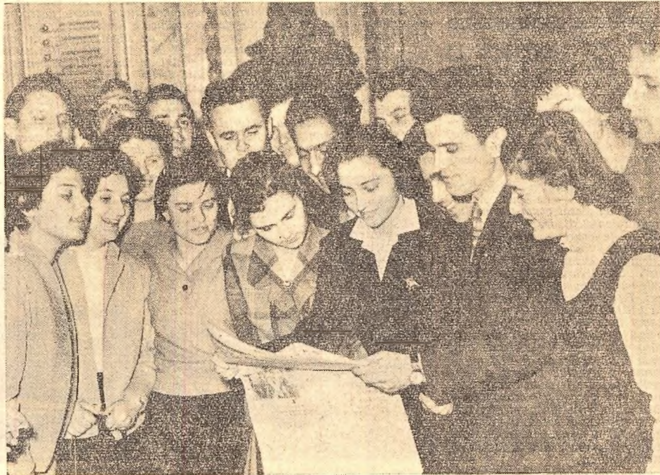
Într-o pauză a conferinței; au venit zărele...

În institutul nostru, situat într-un puternic centru industrial, Orașul Stalin — a spus vorbitorul — studenții au condiții optime să primească, pe lingă o temeinică pregătire teoretică, și o pregătire tehnico-practică strîns legată de cerințele dezvoltării industriale. Vorbitorul a evidențiat apoi cîteva din metodele folosite în acest centru universitar în scopul îmbinării pregătirii teoretice cu activitatea practică. El a arătat că unele