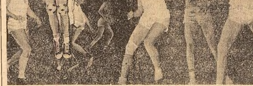
O fază din meciul de baschet R. P. Română-R. Cehoslovacă