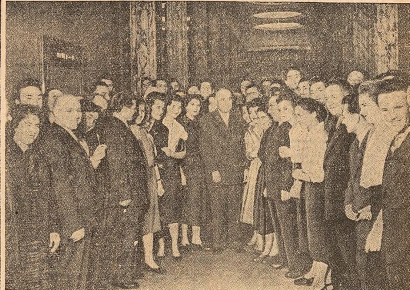
Aspecte de la Conferința pe țară a Uniunii Asociațiilor Studenților din R. P. Romină. Tovarășii Gh. Gheorghiu-Dej, Chivu Stoica și alți conducători ai partidului și guvernului împreună cu grupuri de delegați și delegați din București, Petroșani etc. (fotografia din stînga) și de la universitățile „V. Babeș” și „Bolyai” (fotografia din dreapta).