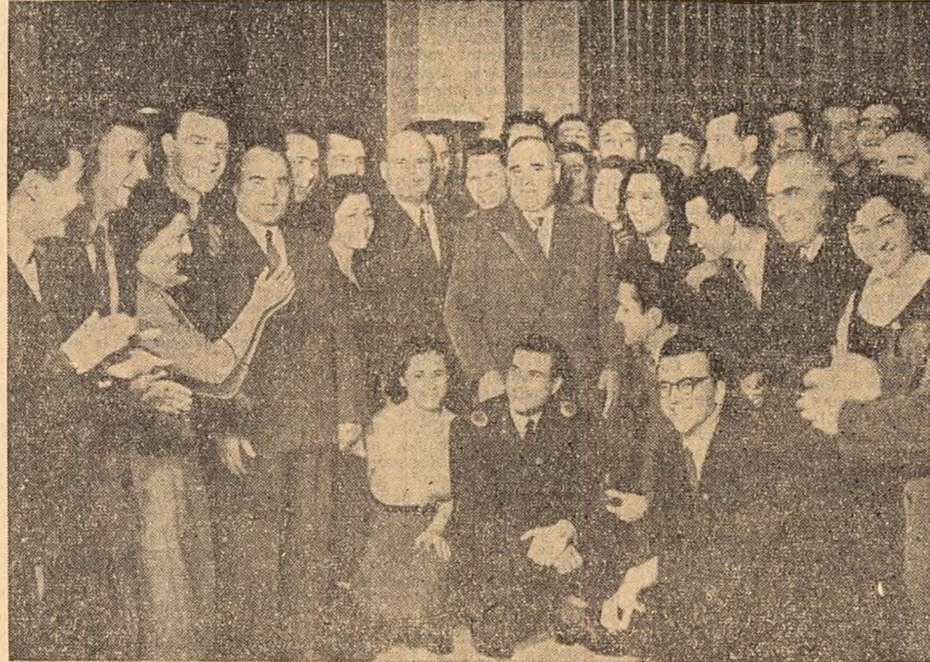
Aspecte de la Conferința pe țară a Uniunii Asociațiilor Studenților din R. P. Romină. Tovarășii Gh. Gheorghiu-Dej, Chivu Stoica și alți conducători ai partidului și guvernului împreună cu grupuri de delegați și delegați din București, Petroșani etc. (fotografia din stînga) și de la universitățile „V. Babeș” și „Bolyai” (fotografia din dreapta).

Spor la muncă și învățătură, dragi tovarășii!