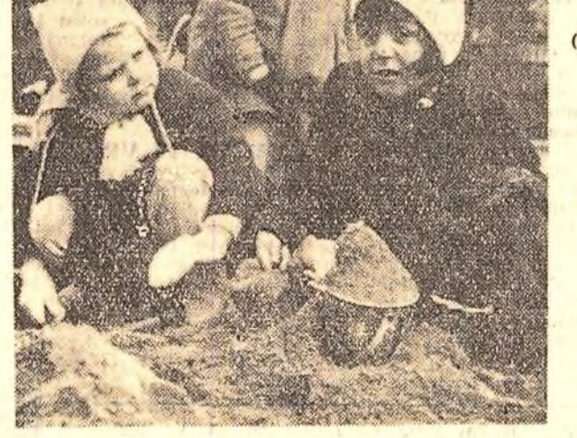
Zi de primăvară... în Cișmigiu...

Prin darea în exploatare a noii stații se descongestionază stația Palas și stația din orașul Constanța, care de acum va deservi numai transportul de călători. (Agerpres)