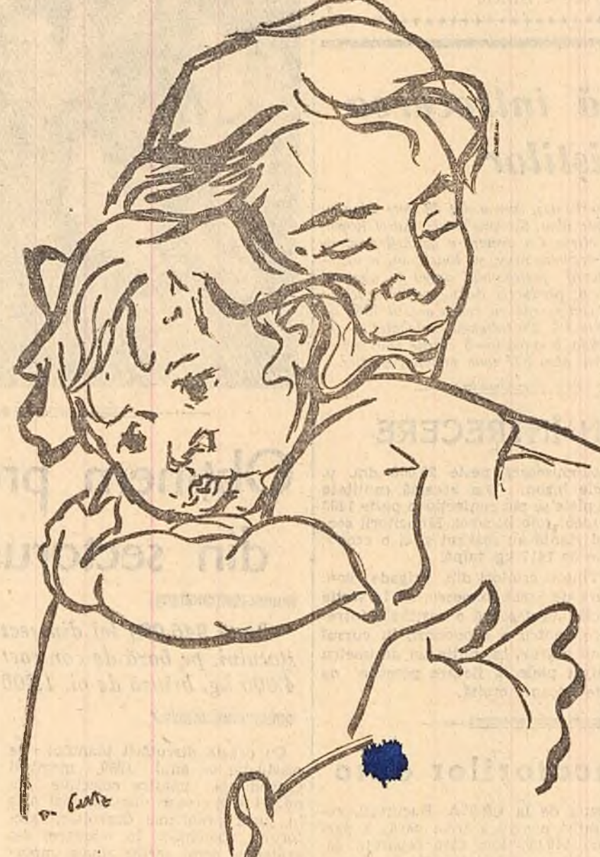
Desen de TIA PELTZ

Minile ei sînt simbolul păcii, al muncii, al dăruirii. Cred că mai mult ca orice pe lume, ele sînt vrednice să fie sărutate cu dragoste, cu evlavie.