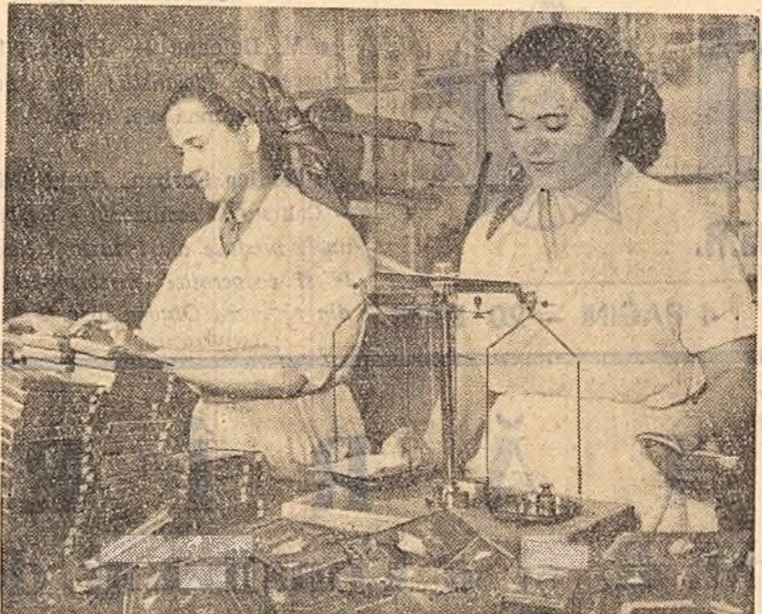
La fabrica de conserve „Mureșeni” din Tg. Mureș se produce pe scară industrială...