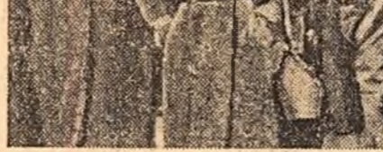
O coloană de muncitori din Hamburg îndreptîndu-se spre un mare miting de protest împotriva înarmării atomice a Bundeswehrului.

Sînt de părere, a spus Ollenhauer, că problema securității și destinderii militare are în prezent pentru Uniunea Sovietică o importanță primordială. Occidentul trebuie să se decidă cit mai repede posibil dacă va duce sau nu la fratele serioase cu Uniunea Sovietică în problema dezangajării bucurilor și a creării unei zone de destindere militară. Acest lucru se referă în primul rînd la Republica Federală. Cred că această încercare corespunde intereselor europene și germane și că trebuie să fie făcută. Dacă această încercare nu va fi întreprinsă cursa înarmărilor va continua iar scindarea Germaniei se va menține pe o perioadă nedeterminată.