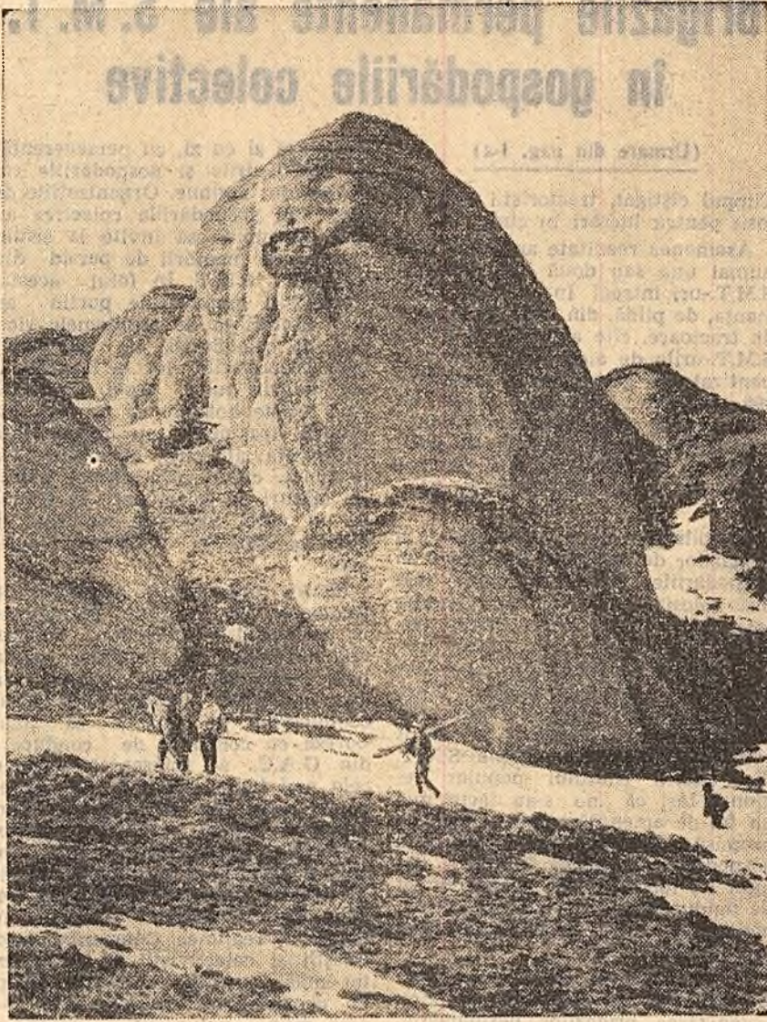
In Munții Clucășului