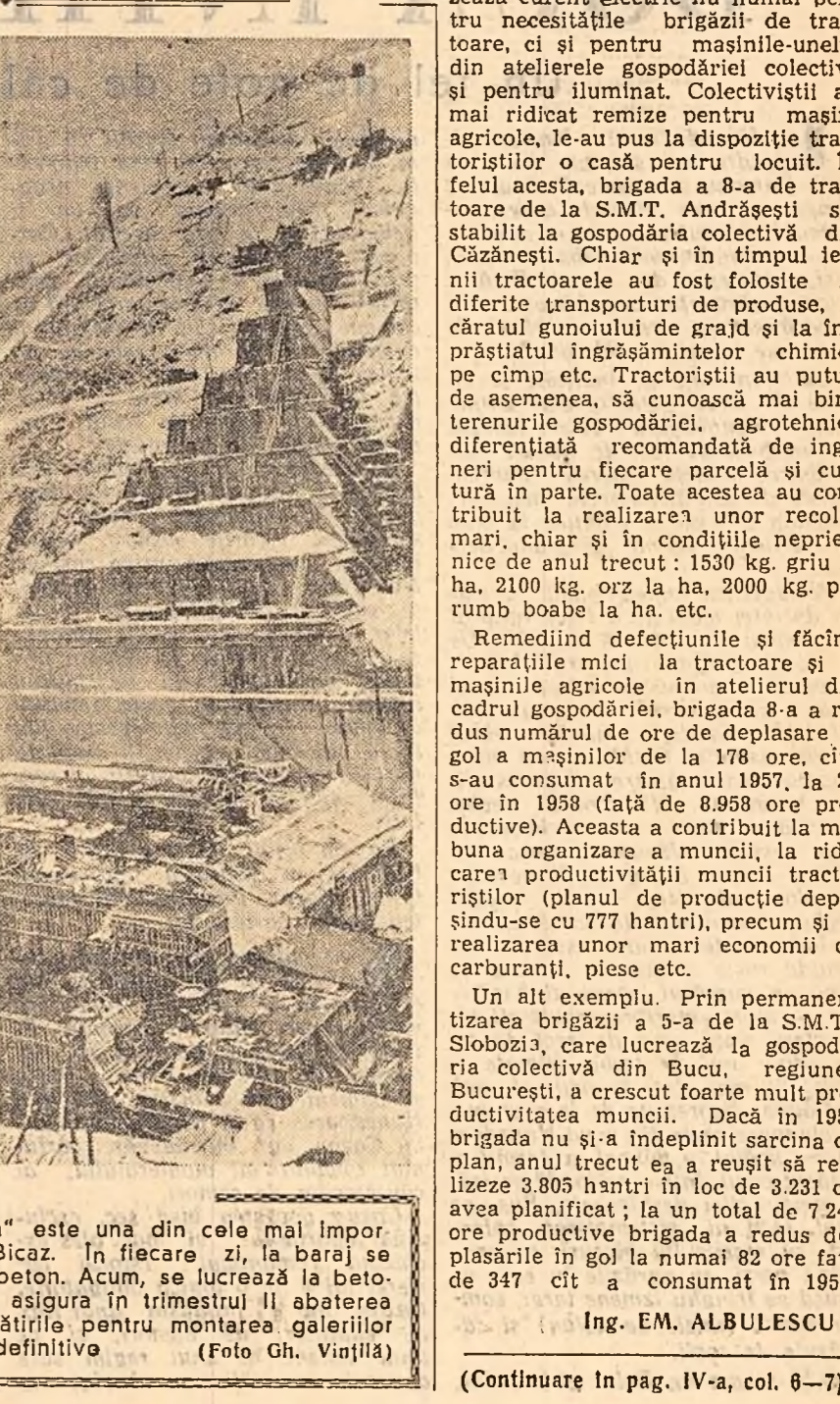
Barajul hidrocentralei „V. I. Lenin” este una din cele mai importante lucrări care se execută la Bicaș. În fiecare zi, la baraj se toarnă peste 1.500 metri cubi de beton. Acum se lucrează la batoanele gurilor de fund pentru a asigura în trimestrul II abaterii de fund definitive