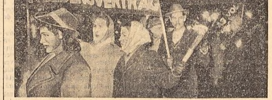
Demonstraţie populară la Hamburg (R.F. Germană) în sprijinul propunerilor U.R.S.S. cu privire la încheierea Tratatului de pace cu Germania