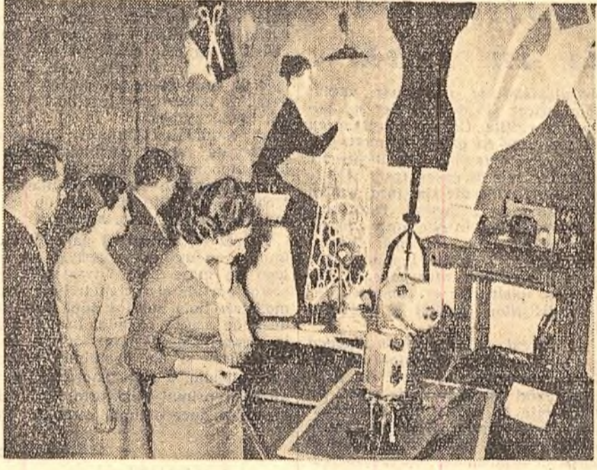
Expoziția de mostre a Industriilor din R. P. Ungară deschisă în Capitală este vizitată cu interes de numeroși cetățeni. În fotografie: Un aspect de la standul unde sînt expuse mașinile moderne de cusut.

După ce a subliniat activitatea vastă pe care o duc sindicatele pentru desfășurarea întrecerii socialiste, raportorul a arătat că în cei cinci ani care au trecut această întrecere a luat o amploare și mai mare în toate ramurile economiei naționale. Au apărut și s-au dezvoltat noi forme de întrecere.