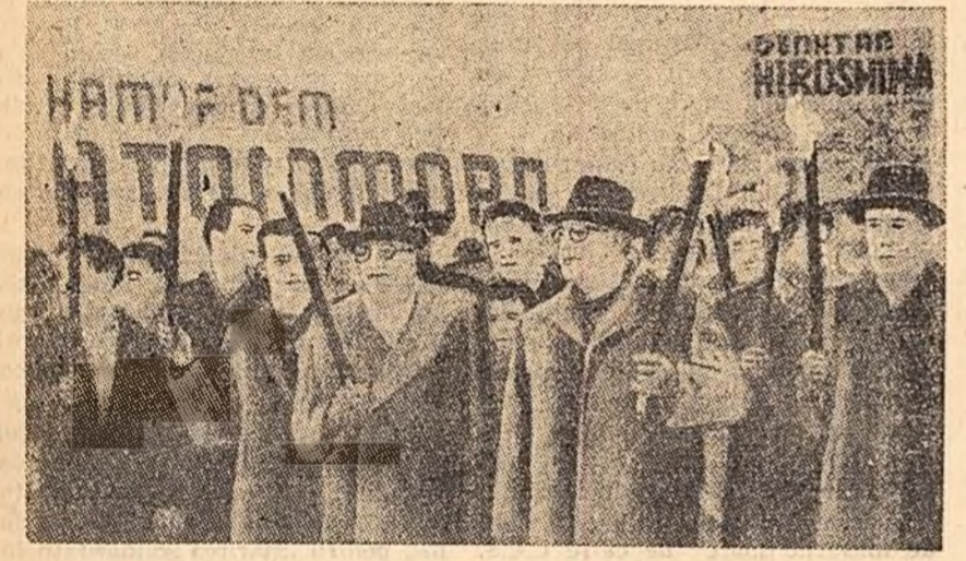
Timp de patru zile, în fața aerodromului militar din Brackel (R. F. Germană) s-a desfășurat o demonstrație de protest împotriva armării atomice. La demonstrație au participat sute de cetățeni. Printre demonstranții s-a aflat și pastorul Martin Nimmoeller.

Unleua Sovietică, se subliniază în declarație, nu poate trece cu indiferență pe lângă faptul că încheierea acordului militar dintre S.U.A. și Iran creează posibilitatea transformării teritoriului Iranului într-un cap de pod militar strategic al puterilor imperialiste împotriva U.R.S.S. Acordul militar cu S.U.A., semnat de guvernul iranian, contravine obligatiilor ce revin Iranului potrivit acordurilor sovieto-iraniene din 1921 și 1927 aflate în vigoare.