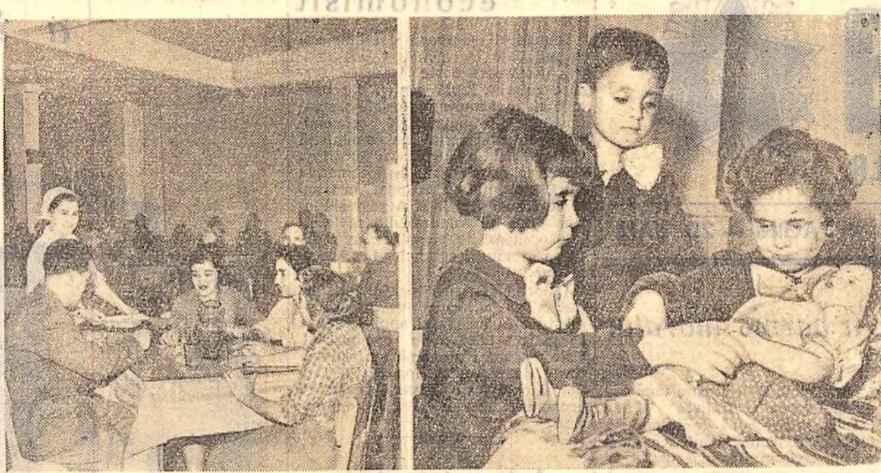
La Industria Bumbacului A din Capitală s-a dat de curând în folosință o cantină. În fotografia din stînga un aspect al cantinei în timpul mesei.