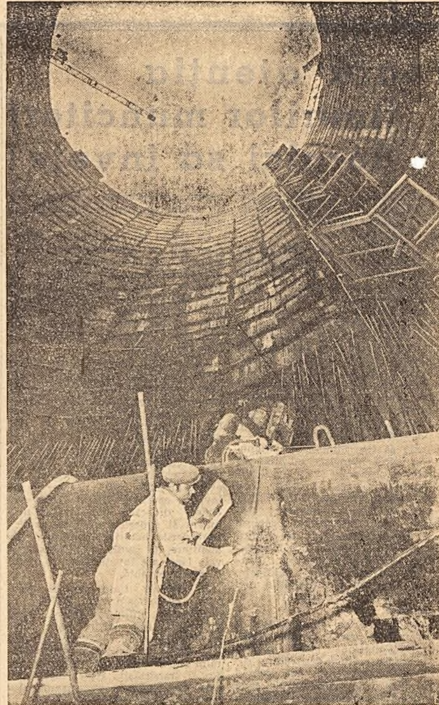
Ca și la barajul hidrocentral, la Bicaz se desfășoară în ritm susținut lucrările de construire a castelului de echilibru; în prezent, blindajele metalice sînt montate, se execută lucrări de betonare și sudură la racordul dintre castel și tunel. Iată, în fotografie, castelul de echilibru unde se sudează blindajul metalic.