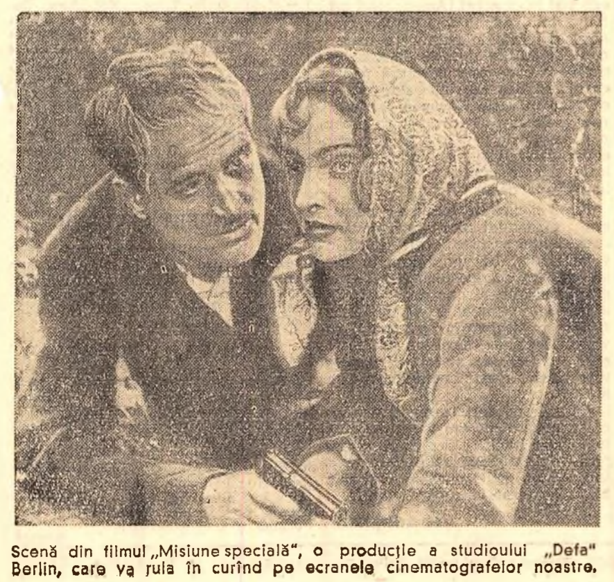
Scenă din filmul „Misiune specială”, o producție a studioului „Defa” Berlin, care va rula în curînd pe ecranul cinematografele noastre.

Asistența a vizitat apoi expoziția care cuprinde 72 de reproduceri după operele unora dintre cei mai renumiți acuareliști din Orient și Occident.