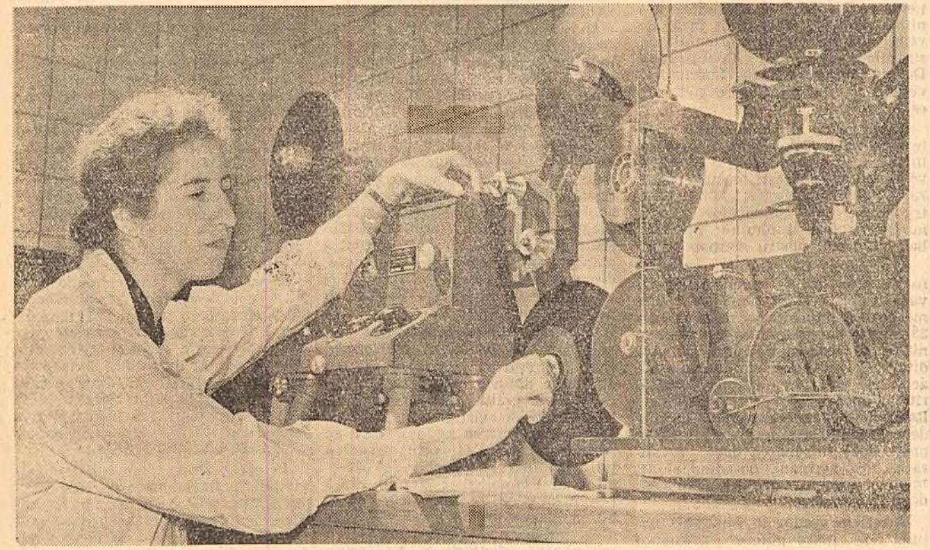
Centrul Universal U.R.S.S., a strâns materiale privind toate observațiile făcute în cadrul Anului geozic internațional. În 1958 circa o sută de mii de tablele cu rezultate științifice au fost expediate de la acest centru în S.U.A., Anglia, Franța, Elveția și alte țări. În curând va fi expediată în S.U.A. și în Anglia o partidă specială de documente privind rezultatele observațiilor întreprinse cu ajutorul sateliților artificiali ai Pământului, lanșați de U.R.S.S. În dispoziție: pregătirea aparatelor, pentru obținerea de microfotografii.

CUM VA FI VREMEA? Pentru următoarele trei zile în țară vreme călduroasă cu cer schimbător. Precipitații locale se vor scumula la sfârșitul intervalului în vestul țării. Vânt slab, până la potrivit Temperatura în creștere mai înfuri, apoi staționară în minimele vor oscila între 3 și 14 grade, iar maximele între 15 și 25, fiind local mai ridicate.