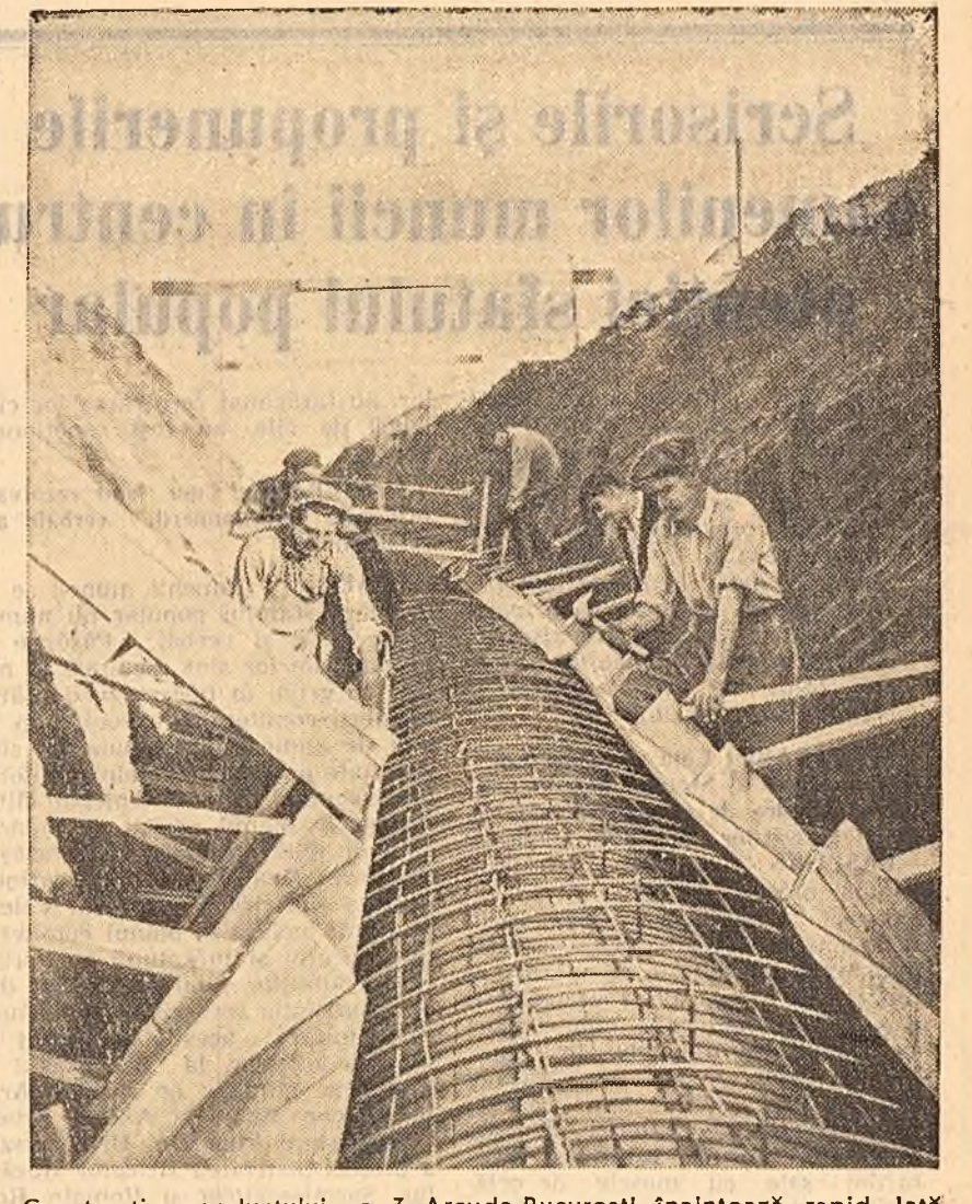
Construcția apeductului nr. 3 Arcuda-București înaintează rapid. Iată un aspect din timpul montării cofrajului conductei. Apeductul are o lungime de circa 15 km. și un diametru de un metru și jumătate.

Manevrele lui abile la masa de comandă răstoarnă transfercarul. Ca pe bandă rulantă, rolele duc blocurile de oțel mai departe, spre aici. Aici se termină drumul lin de pînă acum al lingourilor, începe un adevărat joc — ca al pisicii cu soarecele — în care lingoul este răsuțit pe toate fețele, presat, subțiat, alungit. O foarfecă mecanică de 1.000 de tone retează birna de oțel înroșit exact în clipa și-n locul unde este nevoie. Apoi, marcate cu numărul șarjei, racle și sortate, blumurile uau drumul întreprinderilor care le așteaptă.