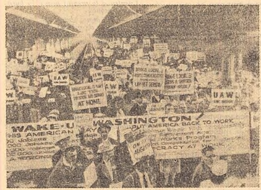
Mii de șomeri americani au venit zilele trecute la Washington pentru a participa la conferința despre șomaj. Ei au cerut guvernului să ia măsuri neîntîrziate pentru lichidarea șomajului.

Nici una din suferințele omeniei din societatea liberă (chiar din context se vede cît de „liberă” este această societate pentru oamenii muncii — N.R.) nu poate fi comparată nici pe departe cu fîrta omenească, cînd după multe zile de căutări zădărnice, după ce și-a epuizat ajutorul de șomaj, trebuie să se întoarcă acasă știind că-și va revinde copiii flămînzii, fără să știe ce să le spună. Oare poate el să le spună că astăzi trebuie să fie mai puțin flămînzii decît ieri, deoarece s-a constatat o anumită îmbunătățire a indiciilor? Eu declar că astăzi toți șomerii se află în aceeași situație proastă ca și guvernantele și că nu ne putem ascunde după cifre. Marea noastră tragedie constă în