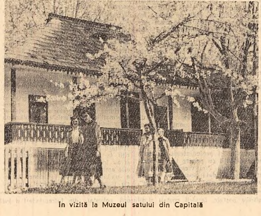
In vizită la Muzeul satului din Capitală