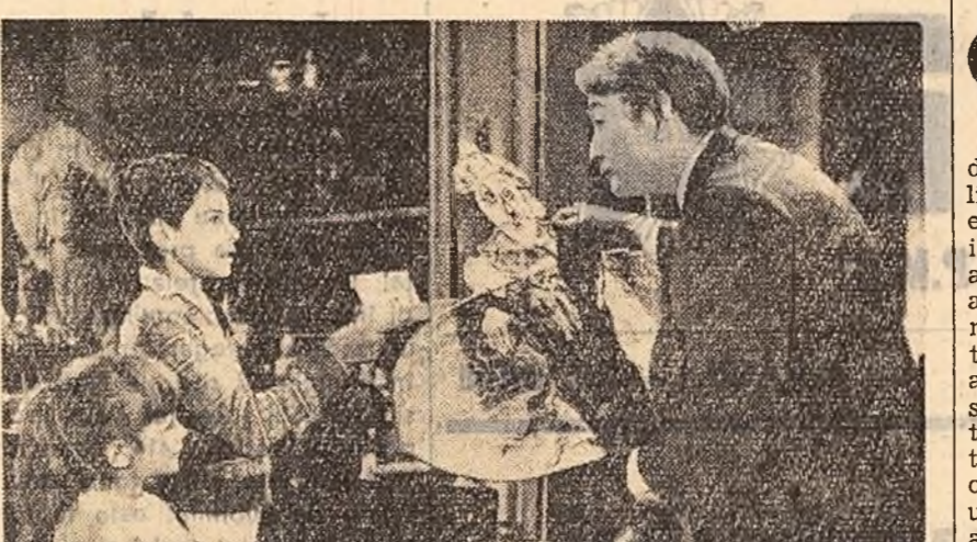
Pe ecranele cinematografelor din Capitală încep să ruleze co-producția franco-chineză „Zmeul de la capătul lumii”. Iată o scenă din acest film.

rul necesar plăților. S-au luat măsuri. Cășeria se deschide acum la ora 7. Cetățenii nu mai sînt neînțeleși la locul de muncă pentru voioși să aștepte (Direcția regională P.T.R. Ploiești). „FĂRĂ SURPRIZĂ” („Scin-teia” nr. 4472). S-au luat măsuri. Lenjeria de la hotelul „23 August” din Pitești se spală și se schimbă la timp. În acest scop, la baia centrală din oraș — intrată de curînd în funcțiune — s-a înființat o spălătorie pentru lenjeria hotelurilor din orașul Pitești. Se vor lua și alte măsuri pentru asigurarea unor condiții cât mai bune de cazare pentru călătorii care vor găzdui la hotelul „23 August” (Comitetul executiv al Statului popular al orașului Pitești).