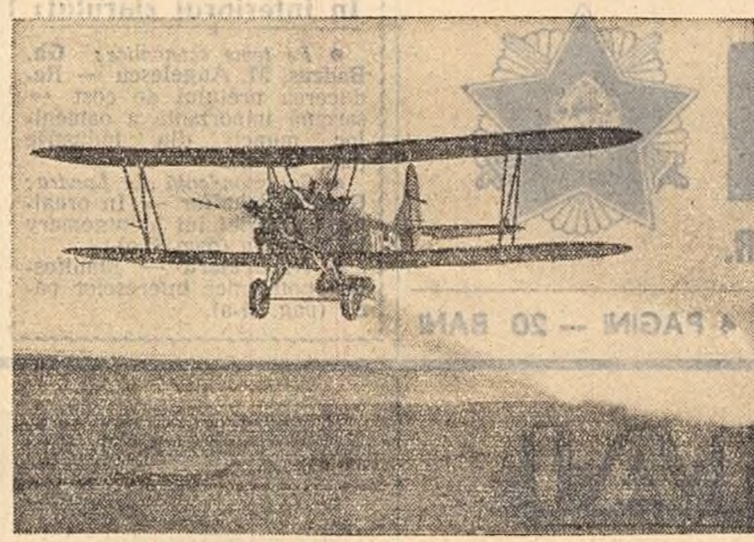
De la an la an, în agricultură sînt tot mai mult folosite avioane pentru împrăștierea de îngrășăminte chimice și preparate pentru combaterea dăunătorilor...