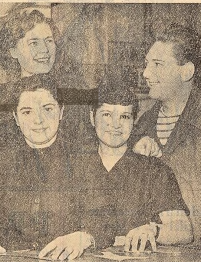
De la începutul anului și pînă acum,