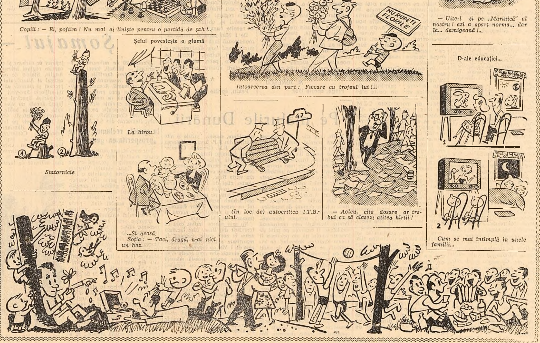
Copiii: — Ei, poftim! Nu mai ai liniște pentru o partidă de șah!...