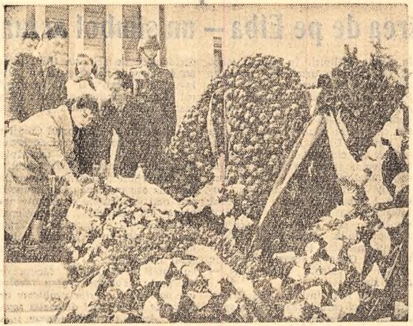
Cu prilejul Zilei Victoriei, în Capitală și în numeroase alte orașe ale țării au avut loc depuneri de coroane în amintirea celor căzuți în lupta pentru înfrângerea coteropitorilor fasciști.