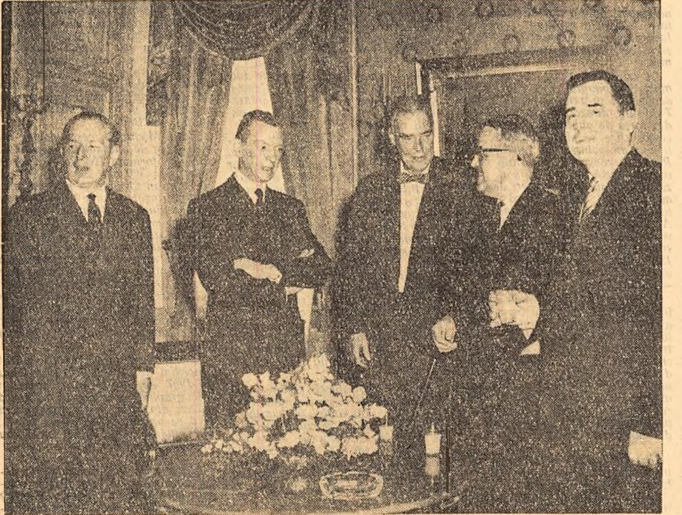
Înainte de începerea ședinței conferinței de la Geneva. În fotografie de la stânga la dreapta: S. Lloyd, ministrul de Externe al Angliei...