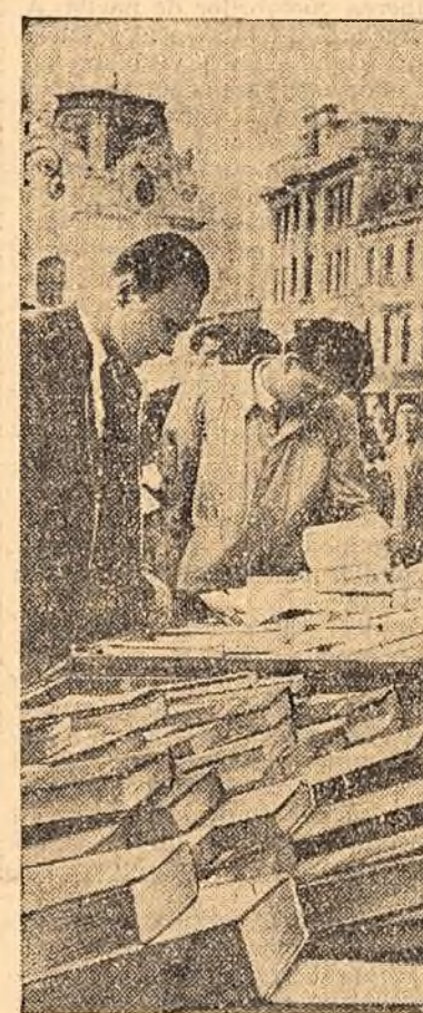
Standurile „Librării Noastre” din orașul Ploiești, instalate în apropierea unor mari întreprinderi sau în locuri mult frecventate, sînt în permanență aprovizionate cu cărți literare și științifice noi. Numeroși oameni ai muncii leau cunoștință, cîrind după apariție, de cărțile ieșite de sub tipar și își aleg lucrările favorite.

La adunările generale ale cooperativelor de consum din regiunea Oradea, cooperatorii s-au lămurit mai bine asupra avantajelor pe care le au dacă se asociază pentru a vinde cantități mai mari de produse agricole statului. Ca urmare, în regiune s-au înființat asociații pentru contractarea vinzării prin cooperative a 3.700 tone grîu, 170 asociații pentru 3.000 tone porumb și 160 asociații pentru 2.300 tone floarea-soarelui.