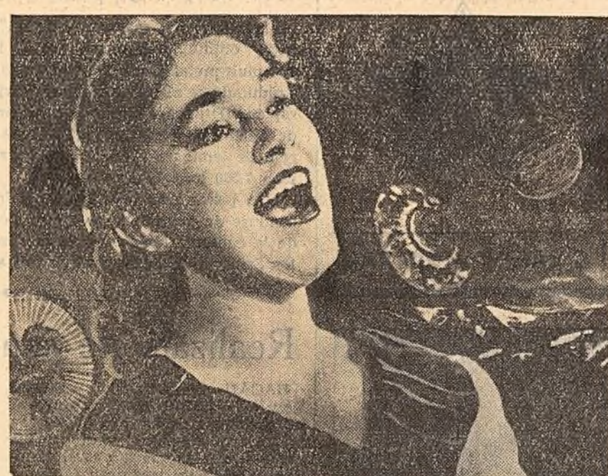
Această frumoasă interpretă cîntă o melodie pe care o vom putea asculta în filmul „Trenul prieteniei”, producție a studioului Mosfilm. Realizat de cunoscutul regizor Grigori Alexandrov, „Trenul prieteniei” este o fantezie muzicală consacrată Festivalului Mondial al Tineretului care a avut loc la Moscova.