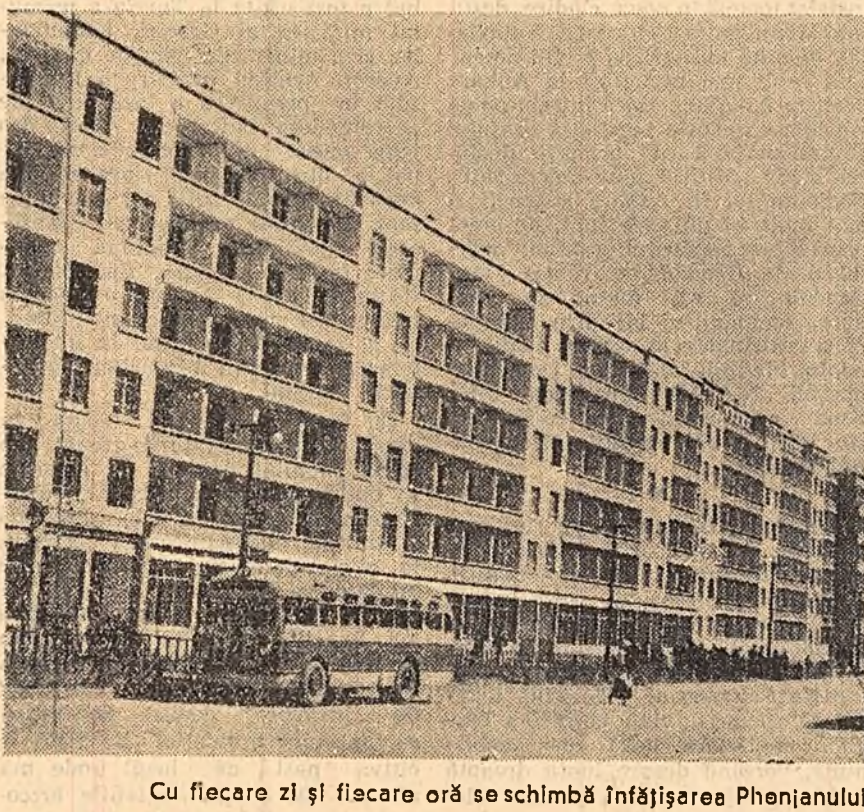
Cu fiecare zi și fiecare oră se schimbă înfățișarea Phenianului capi tala R.P.D. Coreeană

Noi zăcăminte de cărbune bituminos În provincia Hamhinul de nord, în apropiere de fluviul Tumin, au fost descoperite recent noi zăcăminte de cărbune bituminos evaluat la 20.000.000 tone. Echipa de tineri constructori au început construirea unei mine de cărbune cu o capacitate anuală de producție de un milion de tone.