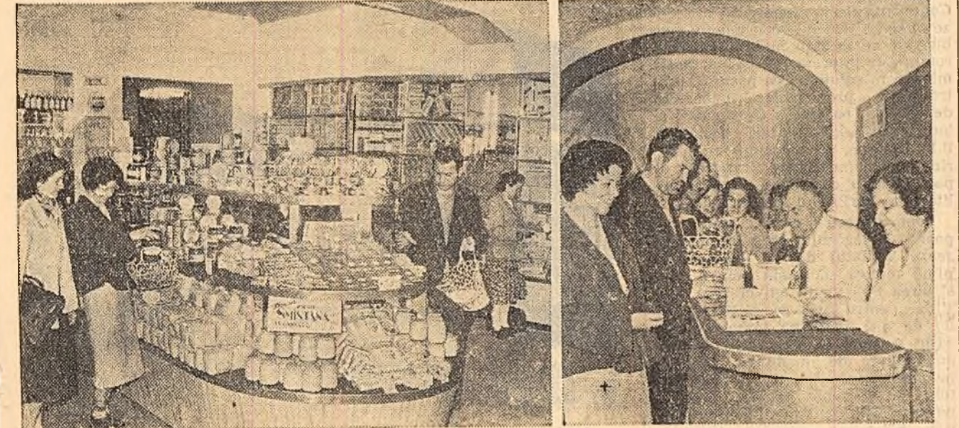
În Orașul Stalin s-a deschis un nou magazin în producție este astăzi o mare forță înnoitoare pusă în slujba progresului tehnic, și ea trebuie sprijinită și dezvoltată necontenit.