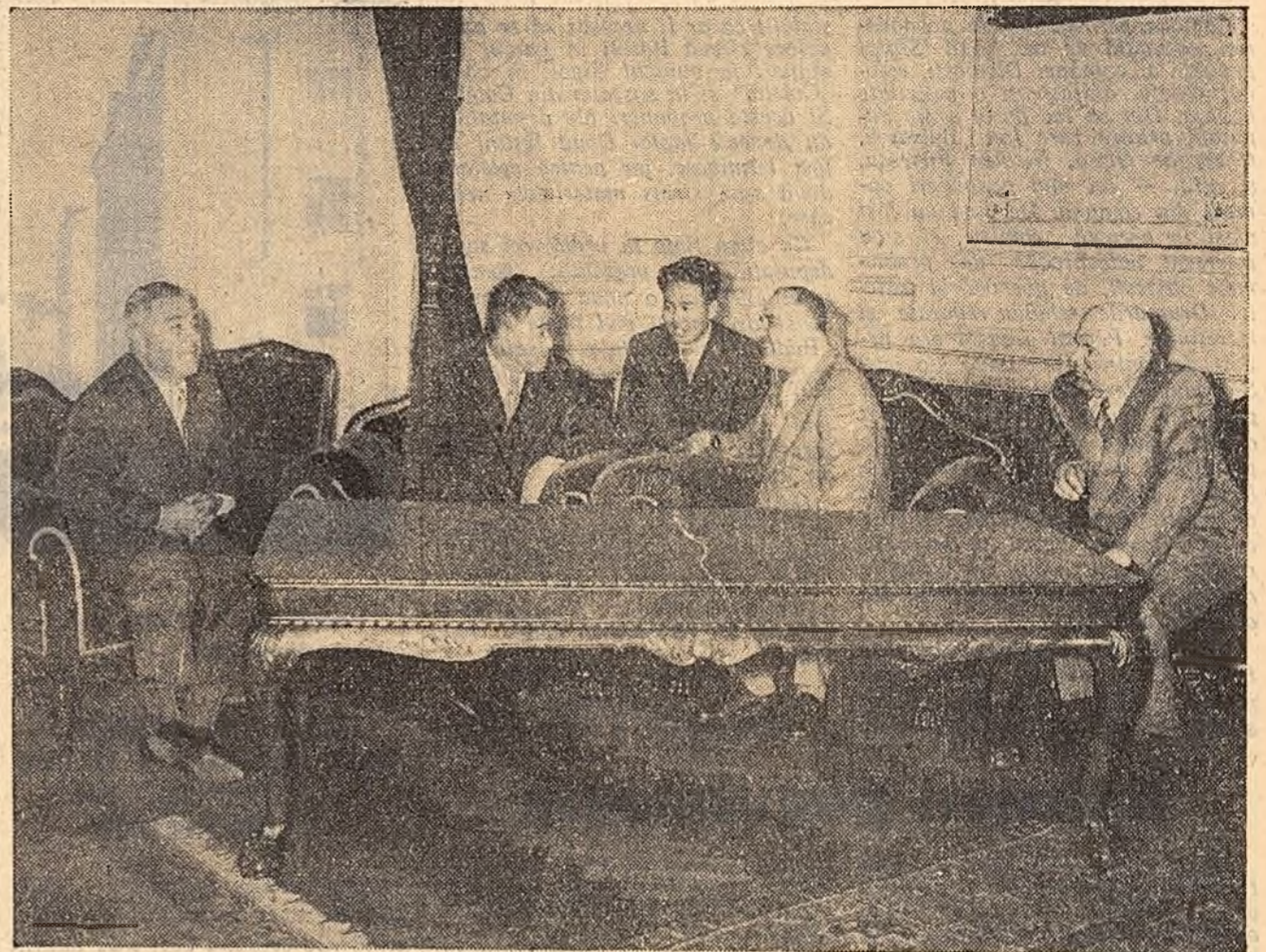
La Prezidiul Marii Adunări Naționale, tovarășul Toi En Ghen întreținându-se cu tovarășii Gh. Gheorghiu-Dej, Chivu Stoica și Ion Gheorghe Maurer.

Vineri dimineața a sosit în Capitală tovarășul Toi En Ghen, președintele Prezidiului Adunării Populare Supreme a Republicii Populare Democratice Coreene.