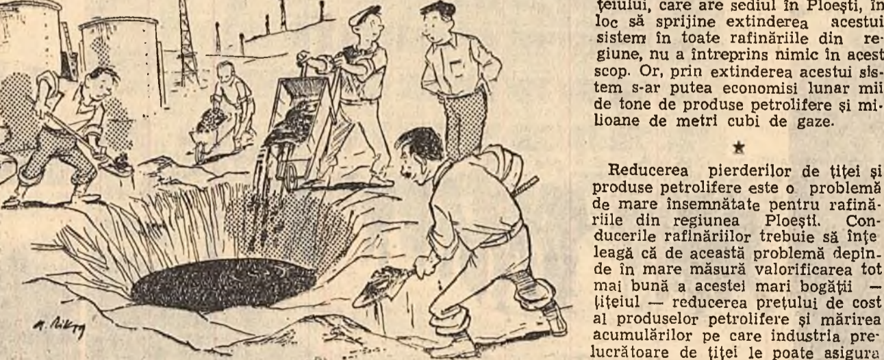
— Ce faceți aici? — Înălțăm pierderile de țitei din rafinării! (Desen de RIK AUERBACH)

Grupurile în care s-au strîns reziduurile de țitei sînt pur și simplu astupate cu pămînt.