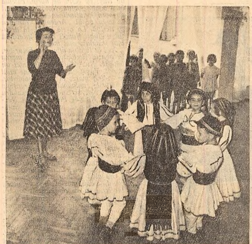
Echipa micilor dansatori de la cîmînul săptămînal de la Îngă Fabrica de confecții „Gh. Gheorghiu-Dej” din Capitală, sub privirile atente ale educatoarei repetă pentru spectacolul pe care-l vor da de „Ziua copilului”.

Numărate sînt acțiunile dinieresti pentru ziua de 1 Iunie ce se vor organiza la Palatul Pioneerilor din Capitală. Micile expoziții cu lucrări ale scolarilor vor constitui o trecere în revistă a activității fiecărui cerc. Vor fi