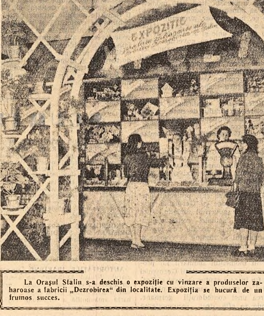
La Orașul Stalin s-a deschis o expoziție de vânzare a produselor zaharose a fabricii „Dezrobirea“ din localitate. Expoziția se bucură de un frumos succes.

În stațiunile de pe litoral oaspeții s-au interesat de lucrările pentru reconstrucția părții centrale a orașului Mangalia prin construirea unui centru de odihnă, de lucrările ce se fac la Vasile Roață pentru terminarea amenajării integrale a falezelor și au vizitat noile ansambluri de hoteluri, case de odihnă și case sanatoriale ce au fost clădite în ultimii ani în stațiunea Eforie.