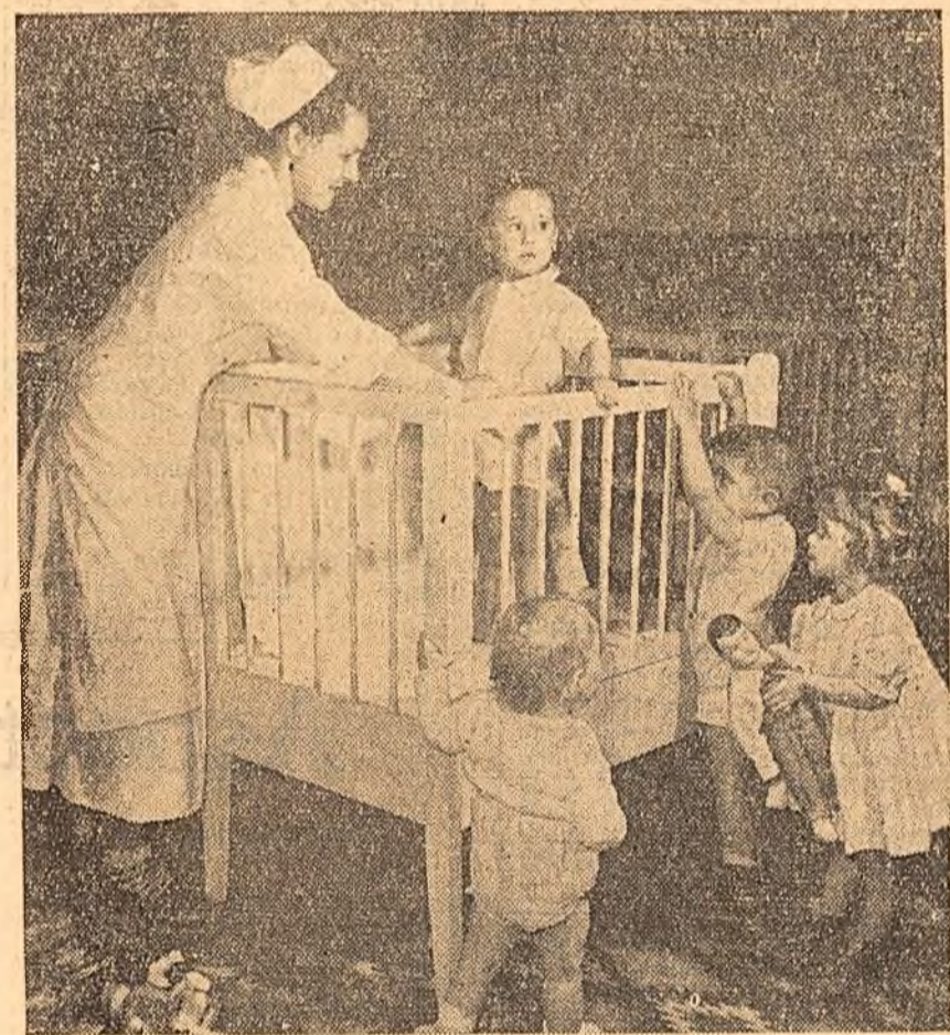
În timp ce părinții lucrează, mulți copii ai muncitorilor de la fabrica „Klement Gottwald” din Capitală se bucură de o atenție îngrijită la creșă sau cîmin. Personal tehnic sanitar de specialitate și educatoare stau în permanență cu copiii. Iată un aspect de la creșă fabricii.