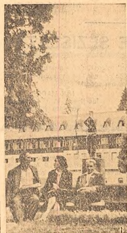
În stațiunea Borsec

BAIA MARE (cosp. „Științei”). Așa se numește cooperativa meșteșugărească din Tara Oașului, care a luat ființă zilele acestea. Noua cooperativă are numeroase secții de deservire a populației. Au început să funcționeze secțiile de radio, foto, zidărie, rotărie, coafură, cîsmărie etc. La propunerea cooperativelor va lua ființă în curînd și o secție care va confecționa vestimenta după modelul minunatului port popular oașesc, bine cunoscut prin originalitatea cusăturilor sale.