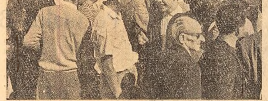
La München (R.F. Germană) a avut loc o demonstrație în cursul căreia s-a cerut Conferinței de la Geneva să creeze condiții pentru semnarea unui Tratat de pace cu Germania și pentru începerea unor tratative între cele două state germane. Cliseul înfățișează garda organizată de acest prilej de studenți în fața Universității din München.

Seful delegației sovietice a supus unei analize și critici minuțioase obiectivitate reprezentanților puterilor occidentale în legătură cu unele prevederi ale proiectului sovietic al Tratatului de pace și a arătat lipsa de temei a acestor obiecții. El a declarat în același timp că dacă delegațiile puterilor occidentale propun o altă formulare a unor articole din Tratat, delegația sovietică este dispusă să examineze aceste formulări și să găsească soluții care să meargă