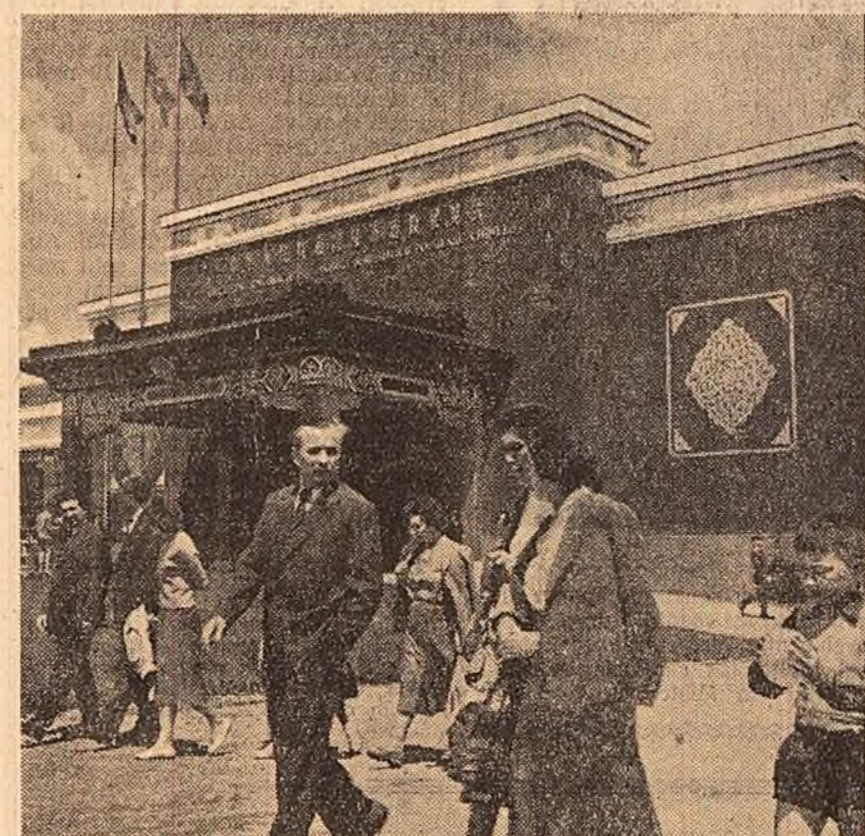
Expoziția „Construcția Economică a Republicii Populare Chineze” deschisă recent în pavilionul din Parcul I. V. Stalin din Capitală se bucură de o mare afleuvență de vizitatori. În fotografie: în fața pavilionului expoziției.