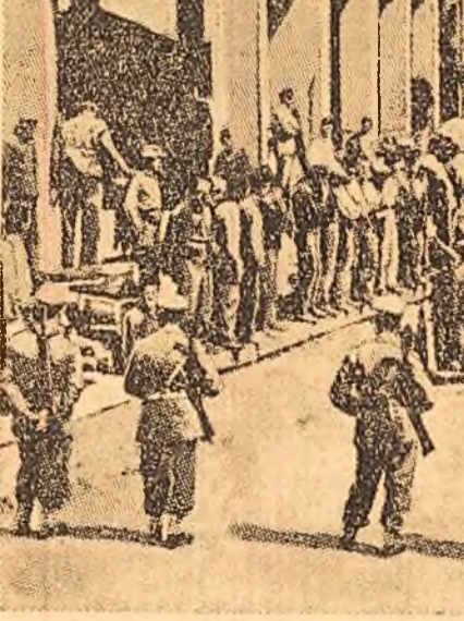
Un aspect al luptelor muncitorești frecvent în Italia: minele din Amlata au fost ocupate de muncitori care încearcă să împiedice asfințirea concedierii anunțată a 735 dintre tovarășii lor. În fotografie: rufele minerilor care au rămas în subteran așteptînd la intrarea minelor.

În descherea rezoluției se vorbește despre necesitatea îmbunătățirii continue a măiestriei artistice, a în-bunătățirii muncii cu încredințat ta-lentat — noul schimb al literaturii.