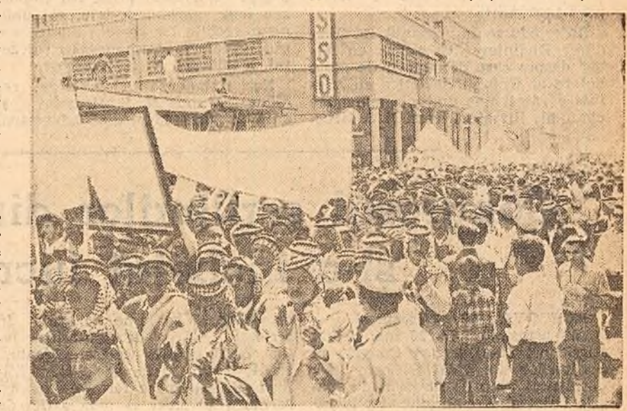
Felahi irakieni participă la demonstrația de 1 Mai de la Bagdad