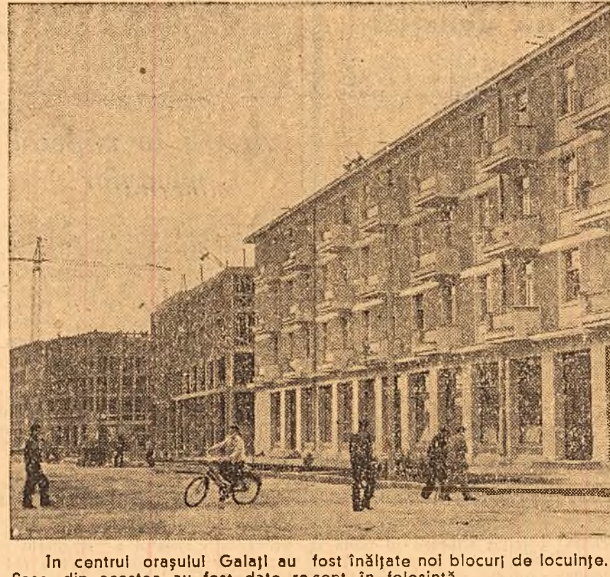
În centrul orașului Galați au fost înălțate noi blocuri de locuințe. Șase din acestea au fost date recent în folosință.

La 1 septembrie noile construcții școlare trebuie să fie gata să-și primească elevii.