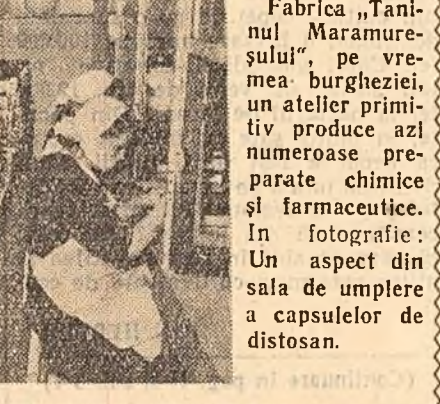
Fabrica „Tanul Maramureșului”, pe vremea burgheziei, un atelier primitiv unde erau produse numeroase preparate chimice și farmaceutice. În fotografie: Un aspect din sala de umplere a capsulelor de distonan.