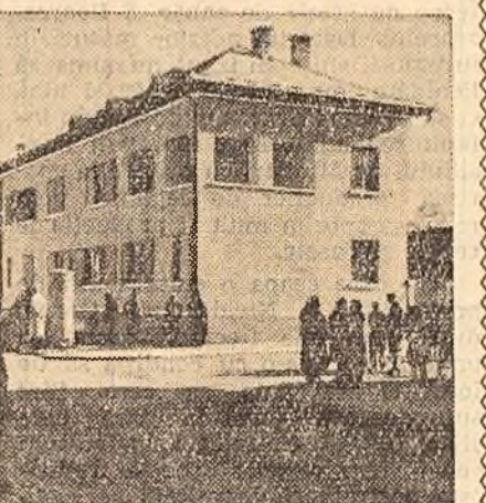
Vișeu este cel mai tînar oraș al regiunii Baia Mare. Pe străzile pavate ale Vișeuului au rășărit și primele blocuri muncitorești.

Independențele platurii maramureșene cu micile lor localități, pitule în văile muntilor, s-au trezit în anii regimului democrat-popular la viață nouă. Cîteva aspecte prezintă și fotografiile alăturate.