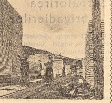
Muncitorii de la U.I.L.-Vișeu își îndeplinesc planurile de producție înainte de termen, dînd peste prevederile planului mari cantități de cherestea. Numai în cîntea zilei de 1 Mai au dat peste plan 1.050 m. c. cherestea. În fotografie: Înregistrarea cherestelei produse peste plan.