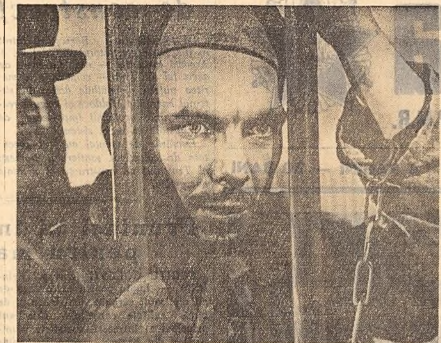
Pe ecranele cinematografulor din Capitală va rula în curînd filmul „Frunza roșii”, o producție a studioului „Belorussfilm”. În fotografie: O scenă din film.