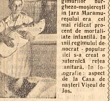
Pe vremea regimurilor burghezo-moșieresti în țara Maramureșului era cel mai ridicat procent de mortalitate infantilă. În regiunile de nord-est populația cîr s-a creat o puternică rețea antitară. În fotografie: aspect de la Casa de Nașteri Vișeu de Jos.