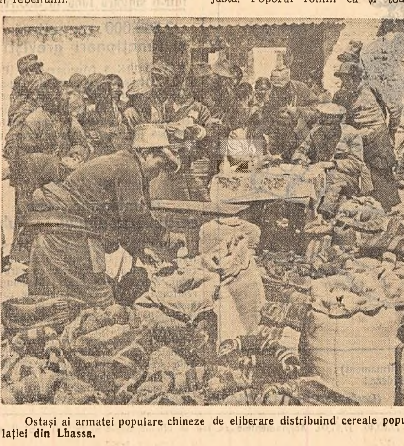
Ostași ai armatei populare chineze de eliberare distribuind cereale populației din Lhasa.

În ciuda eforturilor depuse, campania reacțiunii internaționale a suferit un eșec rusinos. Foarte mulți oameni de pretutindeni și-au dat seama de caracterul reacționar, contrarevoluționar al rebeliunii din Tibet și așa cum se cuvenea, au apreciat zdrobirea ei ca o acțiune justă. Poporul român ca și toate