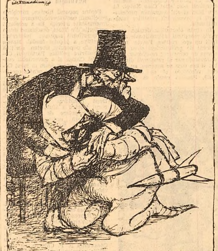
„Războiul rece” (către fabricantul de armament): — Ajutor...! Sovieticii vor să mă lichideze! (Desen de CIK DAMADIAN)

TELEVIZIUNE: orele 19.00 — Informații după-amiezii; 19.05 — Emisiune literară pentru pionieri și elevi; „Ce să citim”; 19.25 — Filmul documentar „Planie tropicale”; 19.40 — Plastica populară; 20.00 — Transmisie de la Teatrul Național „I. L. Caragiale” (sala Comedia) a piesei „Cuza Vodă” de Mircea Stănescu, laureat al Premiului de Slat. În pauze: Jurnalul televiziunii. Postul televiziunii; Ultimele știri. CINEMATOGRAFE: Fata din Kiev (seria I-a) — Patria; București, Grădina 13 Septembrie. Înfrîngerea popoare. Libertății; Fata din Kiev (seria II-a) — Republica; Urmasii lui Kao — Magheru, Lumina. 8 Martie. Plăcări; Legenda dragostei — V. Alexandru; Lady Hamilton — Grădina Dinamo (Cal. Floreasca 20-22). T. Vladimirescu, 23 August; Trenul prietenilor — I. C. Frimu, Giulița. Drumul Serli; Grădinarul spaniol — Central; Drumul ei — 13 Septembrie; Dorința; Maxim Gorki, Gh. Doja, Alex. Sahia; Cel 44 — Victoria. Oltea Bancic; Program de filme documentare și de scene animate — Timburiș, Noi, Alex. Popov; Între noi înfrîngi — Tinerețutil, Aurel Vlaicu; Favoritul 13 — Vasile Roaită, N. Bălcescu; Edeș Anna CUM VA FI VREMEA? Pentru următoarele zile zile în țară: vreme în general frumoasă cu cerul variabil, mai mult senin noaptea și dimineața. Innoarări mai persistente se vor produce în cursul după-amiezilor. Temperatură în creștere: minimele vor fi cuprinse între 10 și 18 grade, iar maximele între 22 și 32 grade.