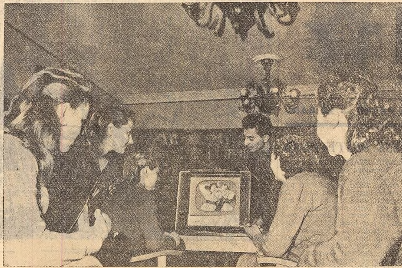
La clubul fabricii „Proletarul” din Bacău, muncitorii vizionează programele prezentate la televizore.