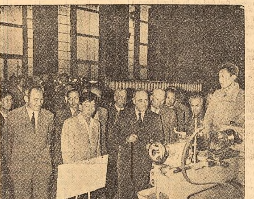
Ziarele de ieri au publicat știrile despre vizitarea de către conducătorii partidului și statului a expoziției „Construcția economică a R. P. Chineze”. Fotografiiile reprezintă aspecte din timpul acestei vizite.