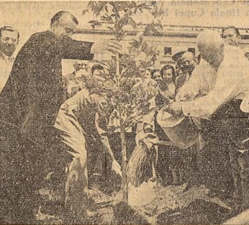
In parcul „Rinia” din Tirana N. S. Hrușciov plantează un „pom al prieteniei” sovieto-albaneze.

TIRANA 3 (Agerpres). — A.T.A. transmite: După călătoria făcută în câteva regiuni din Albania de sud, N. S. Hrușciov și R. I. Malinovski au revenit la 3 Iunie la Tirana. Impresii de înaltă calitate s-au înregistrat la Tirana. Enver Hodja, Mehmet Shehu și celelalte persoane care au