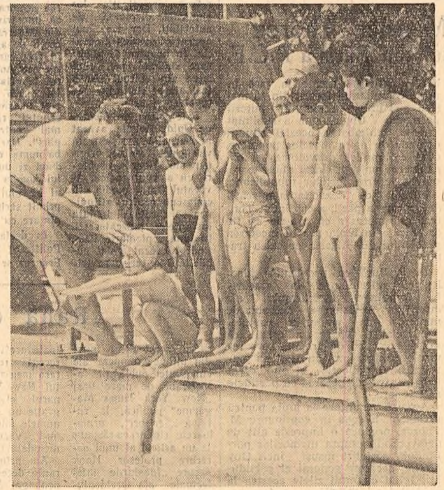
De cîteva zile s-au redeschis centrele de înot pentru copii. Unul din aceste centre funcționează în strandul Tineretului. Fotografia arată o grupă de copii în timpul primelor lecții de înot. (Foto M. Cioc)

ionul Domnești sprijină amenajarea din timp a arilor și asigurarea materialelor necesare pentru aceasta. În prezent, în întreaga regiune București au loc adunări în care deputații prezintă în fața alegătorilor dări de seamă asupra activității lor. La aceste adunări se dezbate și multe probleme gospodărești. Pină acum, la adunările care au avut loc au participat peste 140.000 cetățeni.