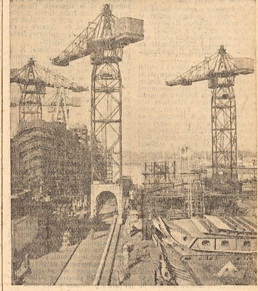
Pe șantierele maritime din portul Gdansk (R. P. Polonă) se lucrează la construirea unor cargoboturi, alt pentru lărgirea flotei comerciale poloneze cit și pentru export. În fotografie: un aspect al șantiereilor.

TAIZ 6 (Agerpres). — Luind cuvîntul la un miting organizat la Sana, primul moștenitor al Yemenului, El Badr, a declarat că poporul yemenit va continua să lupte pînă ce sudul Yemenului va fi eliberat. După cum se știe, sudul Yemenului cuprinde colonia și protectoratele din Aden aflate sub dominație imperialistă.