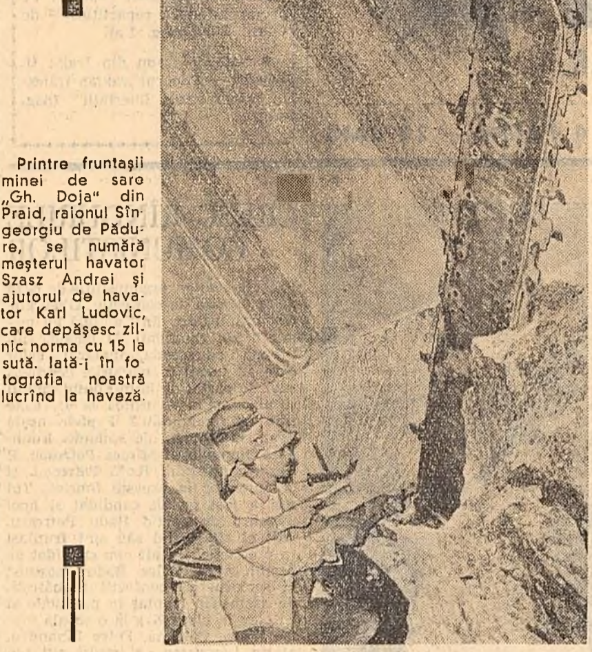
Pîntre frunțile minei de sare „Oh, Doja” din Prald, raionul Sîngerei...