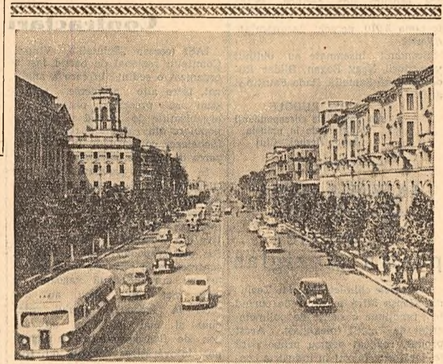
Vedere din Minsk, capitala R.S.S. Bielorusie. Strada Sovietskaia.

tați apoi produsele expuse: aparate de măsurat electrice, instalații și aparate pentru telecomunicații, aparate optice, aparate de fotografiat și filmat. Noua expoziție, organizată în strada Otetari nr. 3, va fi deschisă pînă la 18 iunie. (Agerpres)