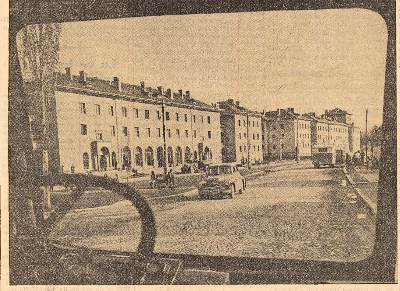
O stradă din Onești — vedere luată din automobil. Pe aici, cu puțin timp în urmă, era cîmp deschis. Acum sînt blocuri de locuințe, magazine și parcuri. Oneștiul devine un puternic centru muncitoresc. În el locuiesc muncitorii rafinării și combinatei chimice care se construiesc aici.

EM. ALBULESCU (Continuare în pag. III-a, col. 1-2)