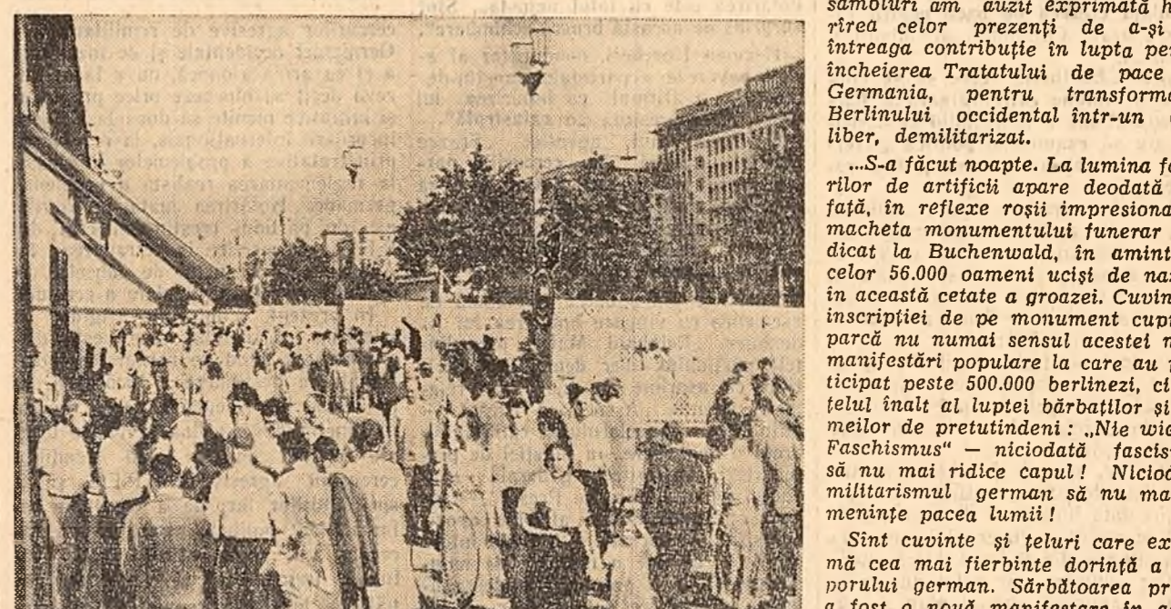
Pe Alea Stalin o mare mulțime a venit să participe la tradiționala serbare a presei democratice germane.