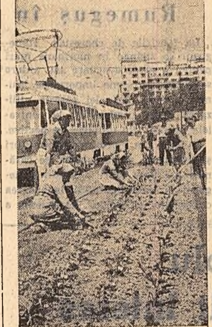
Pe Bulevardul 1848 se plantează florii.