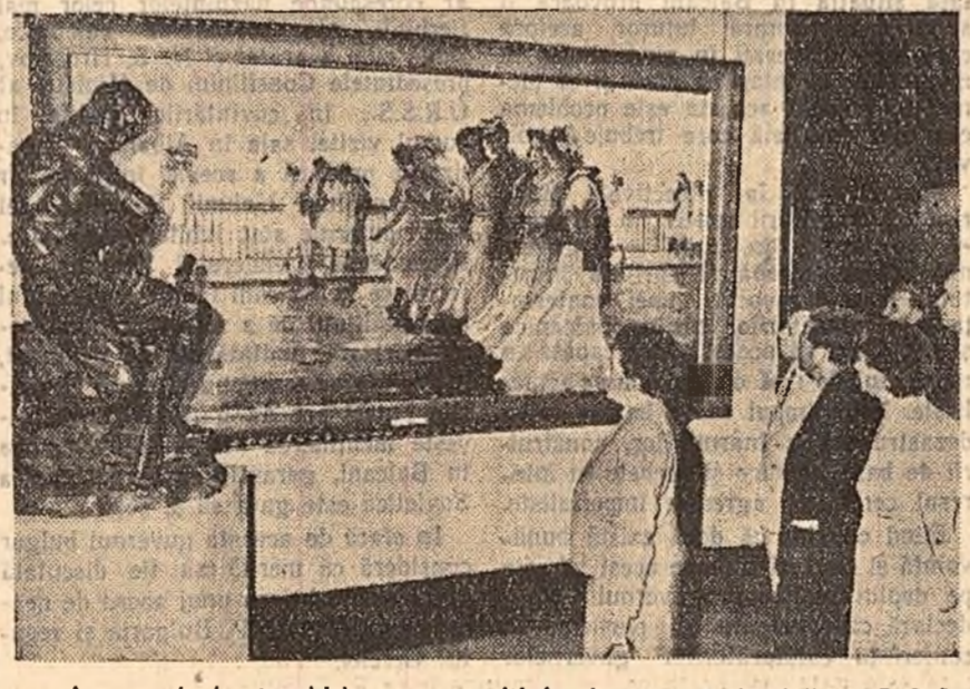
Aspect de la deschiderea expoziției de artă plastică a R. S. S. Bieloruse.