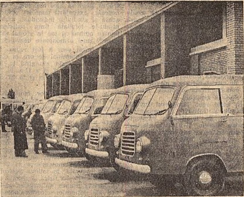
Uzina „Tudor Vladimirescu” din Capitală fabrică în afară de autobuze, trolleybuze și mașini auto-utilitare. În fotografie: Un nou lot de auto-utilitare. Se face un ultim control înainte de expediție.