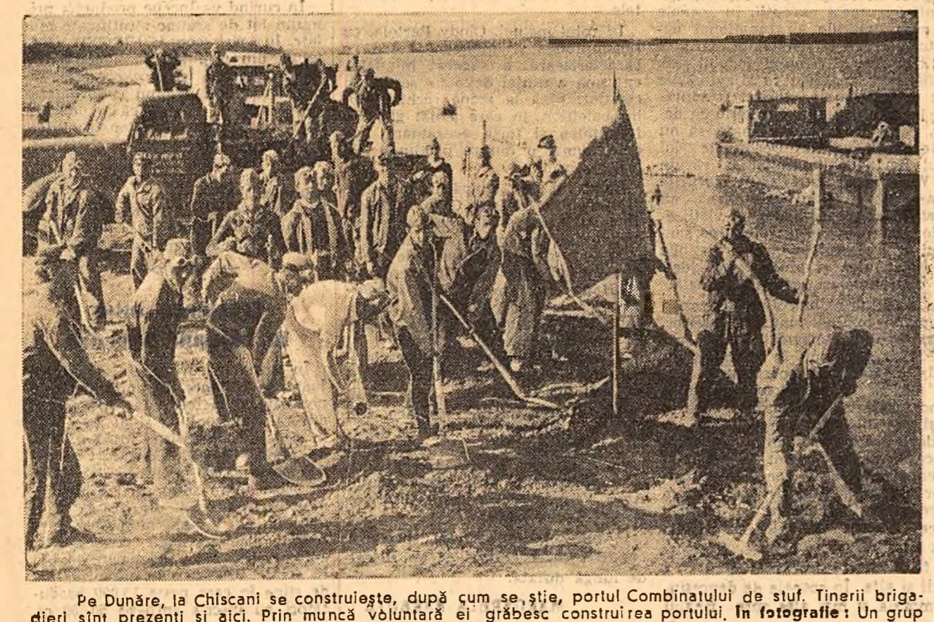
Pe Dunăre, la Chiscani se construiește, după cum se știe, portul Combinatului de stuf. Tinerii brigadierii sînt prezenți și aici. Prin muncă voluntară ei grăbesc construirea portului. În fotografie: Un grup de brigadierii muncind la digul viitorului port.