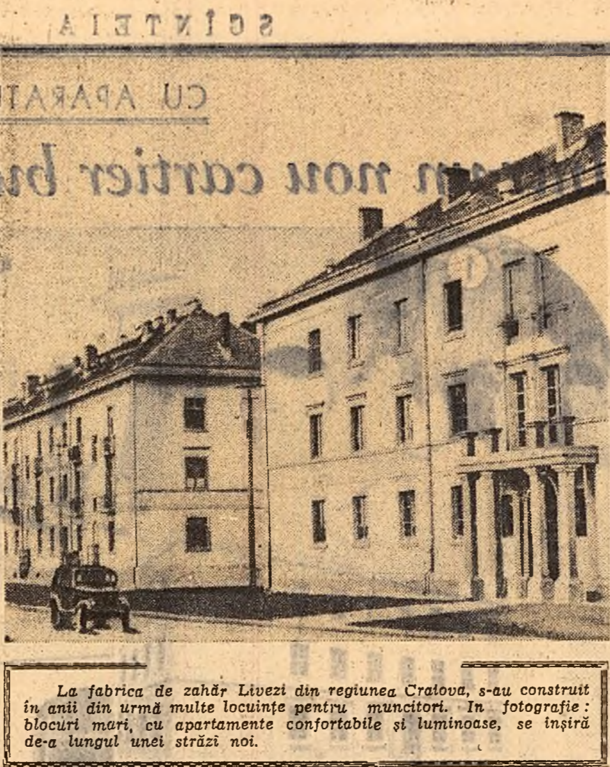
La fabrica de zahăr Livezi din regiunea Craiova, s-au construit în anii din urmă multe locuințe pentru muncitori. În fotografie: blocuri mari, cu apartamente confortabile și luminoase, se înșiră de-a lungul unei străzi noi.

Pînă la sfîrșitul lunii iunie, institutul va mai preda documentația pentru încă 116 apartamente.