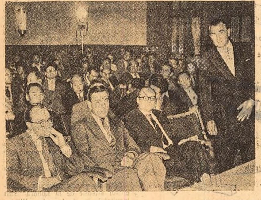
În cadrul unei conferințe de presă care a avut loc la Berlin, patru foști colaboratori principali ai serviciilor de spionaj american, englez, francez și vest-german, au dezvăluit activitatea criminală desfășurată în Berlinul de vest de oficinele de spionaj imperialiste.

Referindu-se la felul în care Silvestri a dirijat Simfonia V-a de Cealikovski — autorul cronicii subliniază că „a fost cea mai avîntată, cea mai triumfătoare, cea mai strălucitoare interpretare a acestei piese prezentată vreodată la Sydney.” Dirijorul român a făcut să apară în această simfonie o emoție dezlănțuită în lozinci sentimentalistului molatec care nu este alt decît deosebită înfățișare a nota caracteristică a muzicii lui Cealikovski. Criticul muzical al ziarului consideră că „chiar dacă unii nu li se pare că interpretarea lui Silvestri ar fi prea puțin sentimentală, iar tempourile prea rapide, ea a fost o realizare magistrală.”