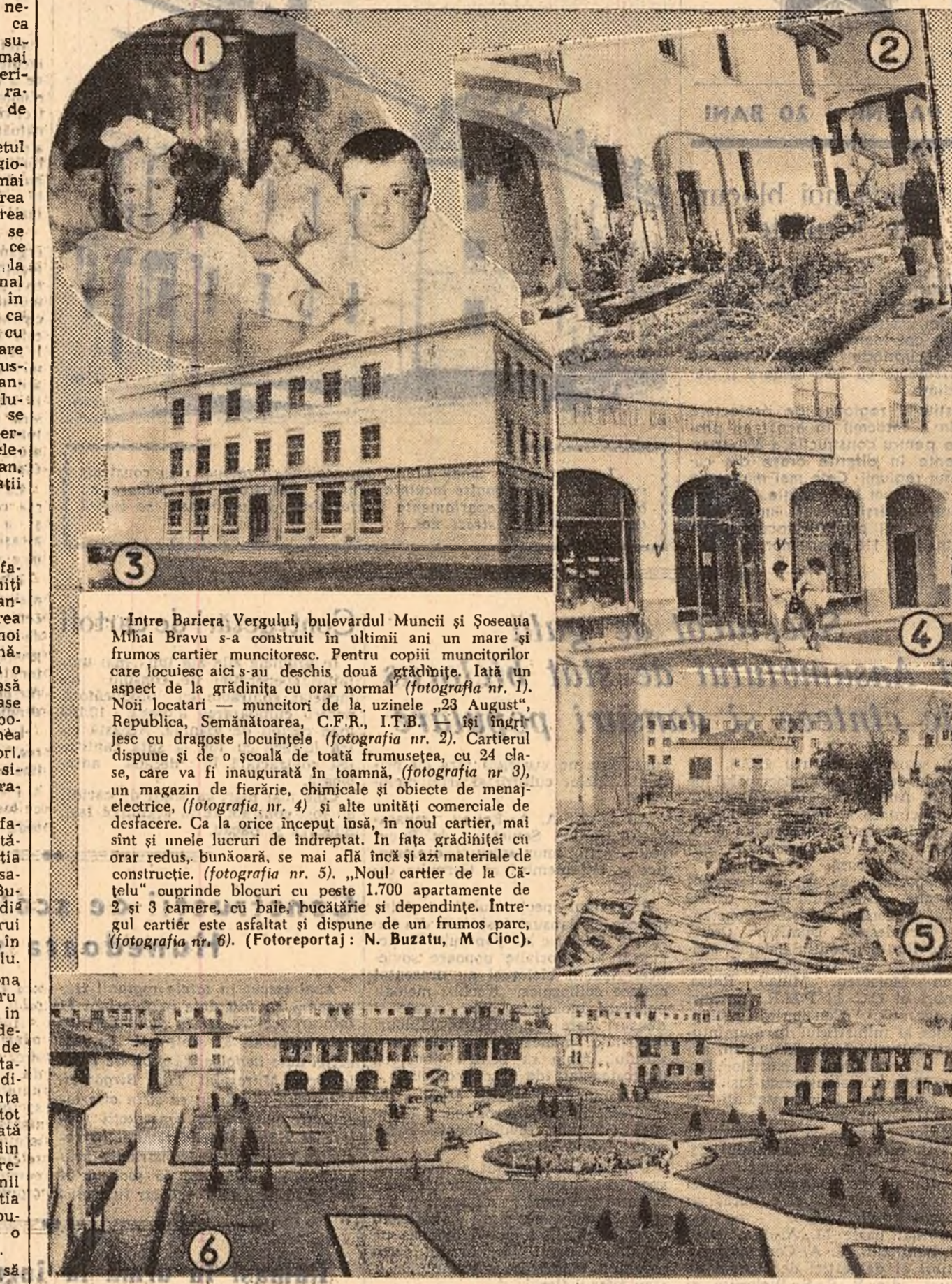
„Între Bariera Vergului, bulevardul Muncii și Șoseaua Mihai Bravu s-a construit în ultimii ani un mare și frumos cartier muncitoresc. Pentru copiii muncitorilor care locuiesc aici s-au deschis două grădinițe. Iată un aspect de la grădinița cu orar normal (fotografia nr. 1). Noii locatari — muncitori de la uzinele „23 August” Republicii, Semănătoarea, C.F.R., I.T.B. — își îngrădesc cu dragoste locuințele (fotografia nr. 2). Cartierul dispune și de o școală de toată frumusețea, cu 24 clase, care va fi inaugurată în toamnă. (fotografia nr. 3), un magazin de fierărie, chimicale și obiecte de menaj-electrice. (fotografia nr. 4) și alte unități comerciale de desfacere. Ca la orice început însă, în noul cartier, mai sînt și unele lucruri de îndreptat. În fața grădiniței cu orar redus, bunăoară, se mai află încă și azi materiale de construcție. (fotografia nr. 5). „Noul cartier de la Cîrteleu” cuprinde blocuri cu peste 1.700 apartamente de 2 și 3 camere, cu baie, bucatărie și dependințe. Întregul cartier este asfaltat și dispune de un frumos parc. (fotografia nr. 6).