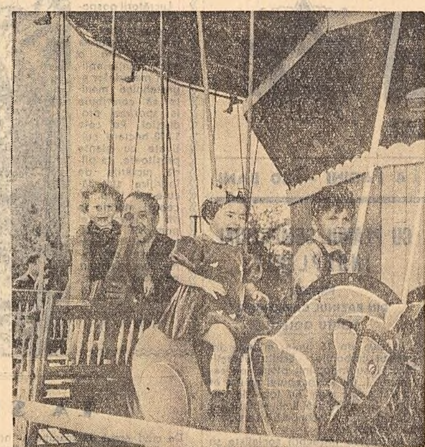
O călăreașă cam fricoasă pentru vijeliosul cal de lemn...

Un om a oprit o mașină. GALAȚI (red. ziarului "Viața Nouă"). - Colectivul de muncă al fabricii de cărămizi silico-calcare de la Doaga obține succese tot mai mari în realizarea sarcinilor de plan. În primele 5 luni ale acestui an a dat peste plan 3.266.000 cărămizi. Totodată muncitorii au mai dat peste plan 10.724 m.c. de balast și au sporit productivitatea muncii peste sarcina planificată cu 20 la sută.