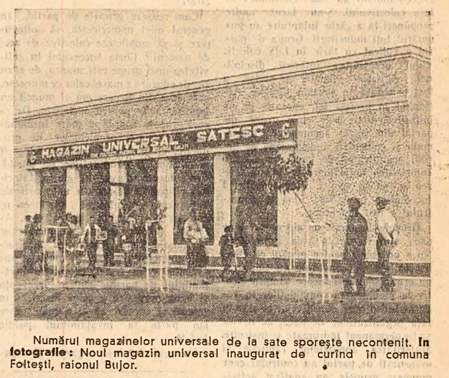
Numerul magazinelor universale de la sate sporțește necontenit. În fotografie: Noul magazin universal inaugurat de curând în comuna Fotoftești, raionul Bujor.

În prezent, la toate stațiile balneo-climaterice din țară există unități C.E.C. sau agenții P.T.T.R. care efectuează operațiuni C.E.C. S-a asigurat astfel, deservirea operativă a depunătorilor prin unități C.E.C. la Vasile Roașii, Mangalia, Constanța, Predeal, Sinaia, Covasna, precum și la celelalte stații balneo-climaterice.