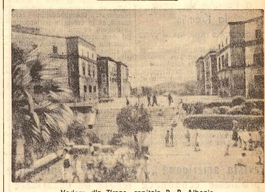
Vedere din Tirana, capitala R. P. Albania.

Anul trecut într-o serie de cooperative agricole de producție și gospodării agricole de stat R.P. Albania au fost create așa-numite loturi de mare randament.