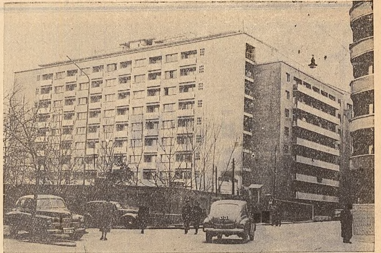
Un nou bloc, înalt de 8 etaje, s-a construit în strada Brezoiului, din Capitală. Blocul a fost dat nu de mult în folosință.