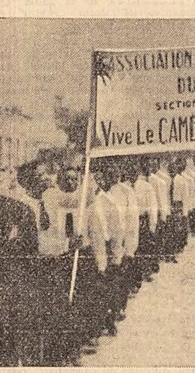
Cu prilejul proclamării Independenței Camerunului, la Yaounde, capi- tala țării, au avut loc mari manifestații festive.

TIRANA 9 (Agerpres). — După cum transmite agenția A.T.A., la propu- nerea unui comitet de inițiativă, la Tirana a avut loc ședința de consti- tuire a Comitetului albanez pentru colaborare și înțelegere reciprocă între țările balcanice. Comitetul își propune să contribuie la stabilirea de relații prietenești cu toate țările balcanice, indiferent de sistemul lor social.