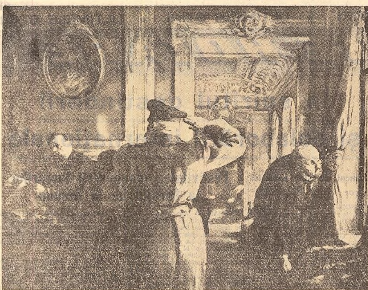
Expoziția artiștilor plastici sovietici care semnează cu pseudonimul Kukrinski (deschisă în sălile muzeului Simu) se bucură de un viu interes în rândul publicului bucureștean.

La 9 ianuarie 1960 a avut loc la Ministerul Afacerilor Externe al R. P. Romine semnarea planului de muncă pentru aplicarea pe anul 1960 a Acordului privind colaborarea culturală între R. P. Romina și R. P. Bulgaria.