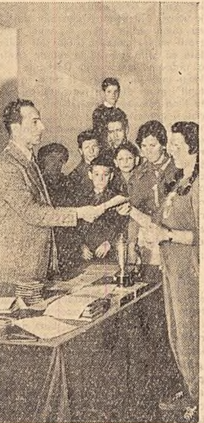
Vineri și sîmbătă, la Palatul pionierilor din Capitală au avut loc întreceri sportive la voley, tenis de masă, box, tir, șah. Au participat pionierii din București, Ploiești și Piești. Fotografia înfățișează momentul premiilor echipei de voley a pionierilor bucureșteni.

Cum s-au obținut aceste realizări? Una din primele măsuri luate de comitetul raional de partid a fost instruirea temeinică a activiștilor săi, a birourilor organizațiilor de bază din gospodăriile colective, îndrumarea și discutarea cu ei sub diferite forme a problemelor legate de dezvoltarea creșterii animalelor. Cadrele noastre de partid și de stat, comuniștii, agitatorii au considerat ca o sarcină principală lămurirea în rîndul masei largi a colectivităților a acestor probleme. Instrucțiunile teritoriale ale comitetului raional de partid au fost în mod special ajutate să cunoască problemele dezvoltării sectorului zootehnic, căuțînd să le trezească interesul pentru aceste probleme. Astfel munca politică în vederea demonstrării avantajelor creșterii animalelor în gospodăria colectivă a fost mai concretă și mai fiercică. Comuniștii, agitatorii au fost îndrumați să arate colectivităților prin socoteli referitoare la propria lor gospodărie ce venituri mari se pot realiza din