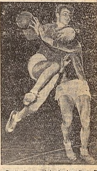
Fază din meclul de handbal Dinamo C.C.A. disputat duminică în sala Floreasca. (În pag. II-a, rubrica de sport)

ghin au produs aproape în fiecare zi, peste sarcinile de producție ce le revin, 50-100 tone oțel. La rîndul lor, furnaliștii au produs, în perioada 1-10 ianuarie, peste sarcinile planului de producție, 561 tone oțet. Laminatorii au depus și ei eforturi în întrecere pentru a asigura prelucrarea unei cantități cit mai mari de oțet. În această perioadă, colectivul secției laminorului-bluming a produs mai bine de 1000 tone laminate peste plan.