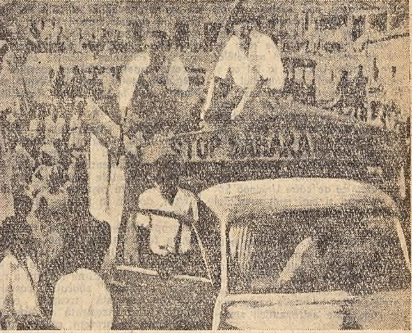
În semn de protest împotriva intenției Franței de a efectua experimente cu bombe atomice în Sahara, un grup de luptători pentru interzicerea armelor atomice au pornit din Accra, capitala Ghanai, spre regiunea Saharei, unde se proiectează să aibă loc experimentele.

DELHI 11 (Agerpres). — TASS. În unele țări, se spune în apel, membrii parlamentului participă activ la lupta pentru pace care se desfășoară în întreaga lume. Noi le adresăm cele mai calde felicitări. Parlamentele unor țări au adoptat rezoluții și mesaje pentru apărarea păcii și pentru dezarmare, pentru întărirea armii nucleare și a experimentării ei. „Fie ca anul 1960, se spune în încheiere în apel — anul convingerii la nivel înalt — să intre în analele istoriei ca un an în cursul căruia omeneirea va pune pentru totdeauna capăt metodelor războiului rece și agresivității și se va angaja pentru todeauna pe calea dezarmării, colaborării și păcii între toate țările. Trăiască pacea!”.