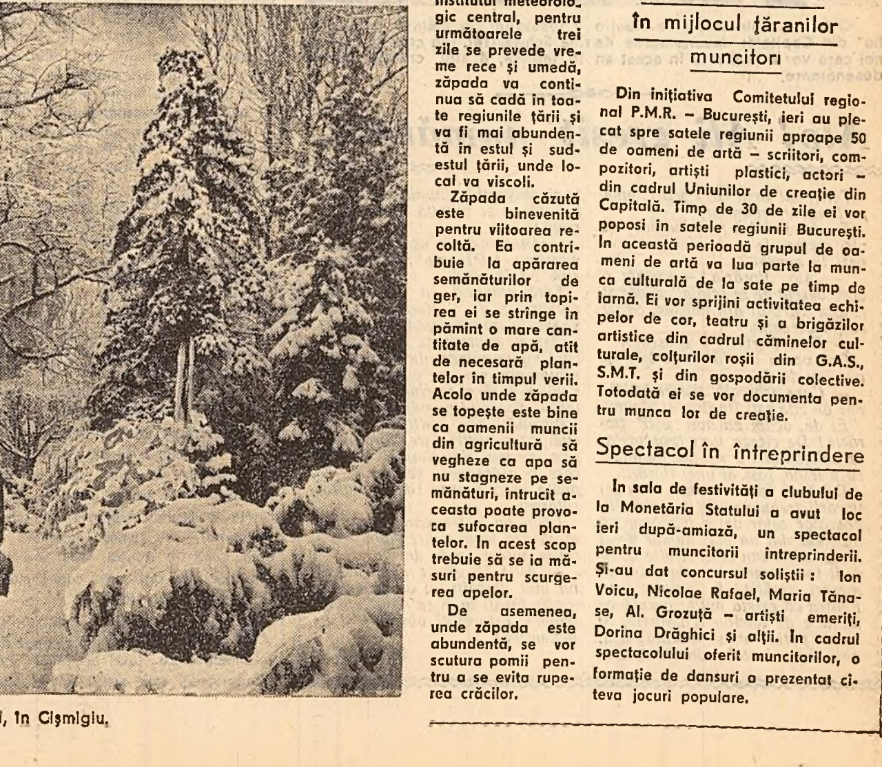
Ieri, în Cîșmigiu.