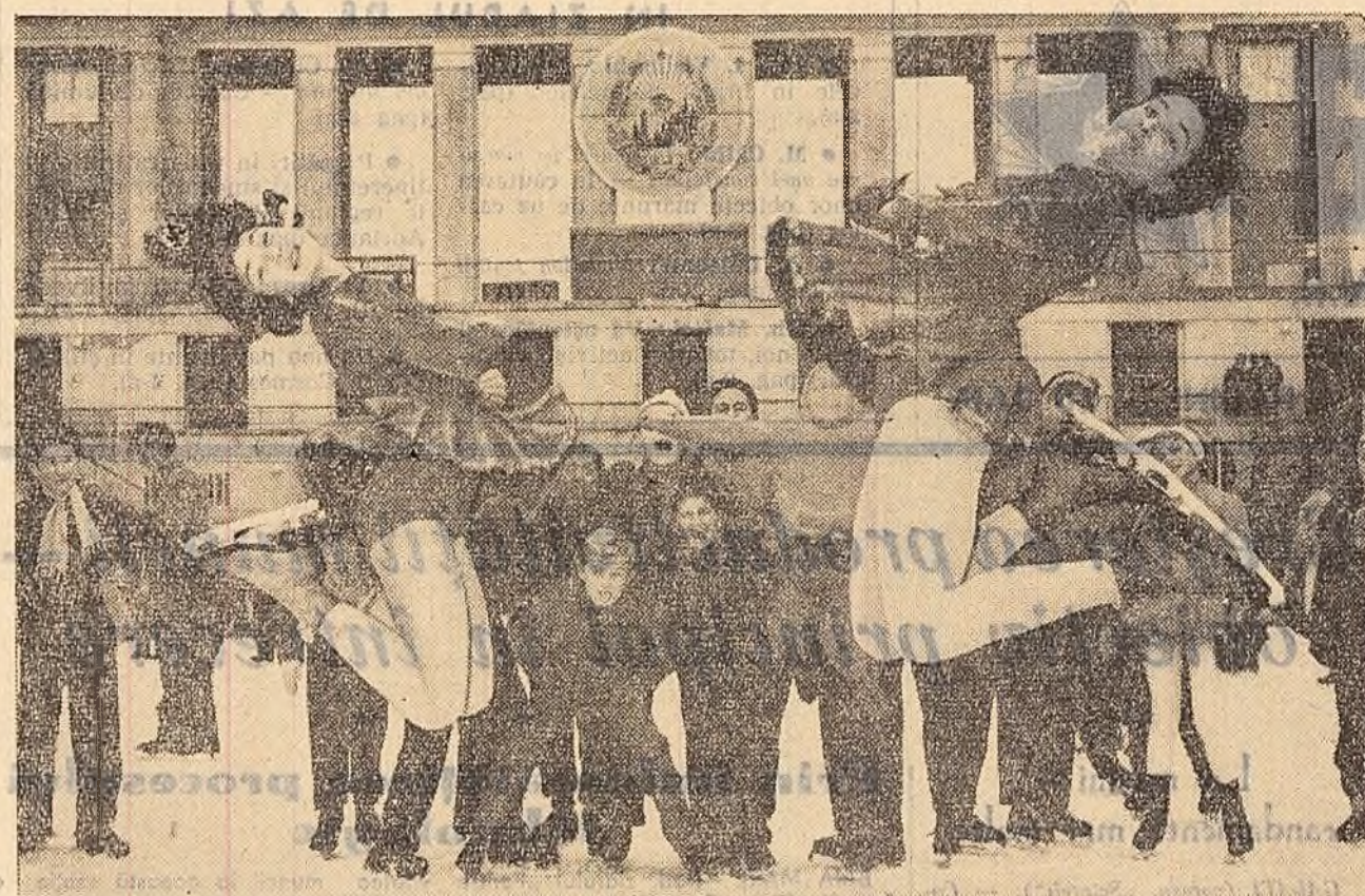
Pe patinoarul artificial „23 August” din Capitală, obiectivul fotografului a surprins „săltura peștelui” executată de două patinatoare de la clubul sportiv „Dinamo”.

Pentru că această metodă și-a găsit o largă răspundere, inginerii și tehnicienii agronomi și zootehnici, conducători de unități agricole socialiste, s-au făcut ca experiențele efectuate cu succes să devină o practică curentă în toate gospodăriile agricole de stat și colective. Aceasta va contribui, alături de metodele zootehnice înaintate, la sporierea producției de carne, ouă și alte produse de origine animală.