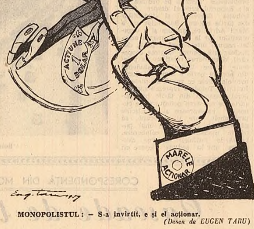
MONOPOLISTUL: — S-a invirtit, e și el acționar. (Desen de EUGEN TARU)