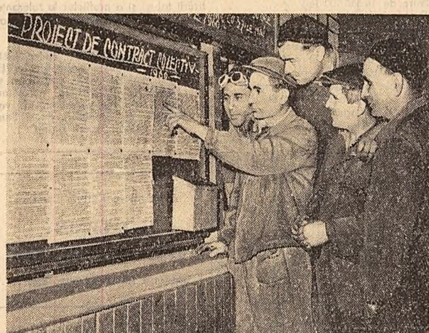
Ieri la uzinele „Tudor Vladimirescu” din Capitală a fost așiat la lucrurile de muncă. În secțiune, proiectul de contract colectiv pe anul 1960. Alături, pe panouri au fost așezate cutii în care muncitorii vor depune propuneri pentru îmbunătățirea proiectului de contract colectiv. Într-un grup de muncitori citind cu interes proiectul noului contract colectiv.