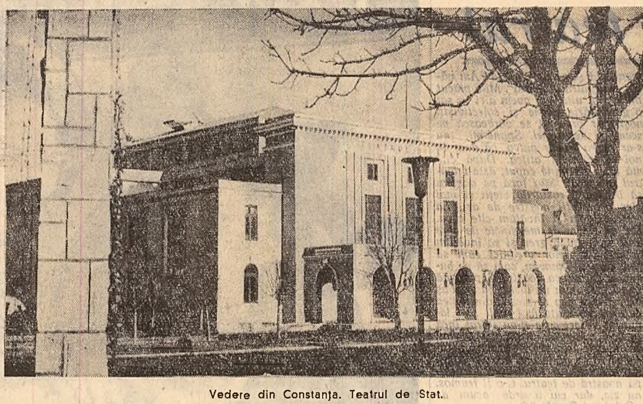
Vedere din Constanța. Teatrul de Stat.