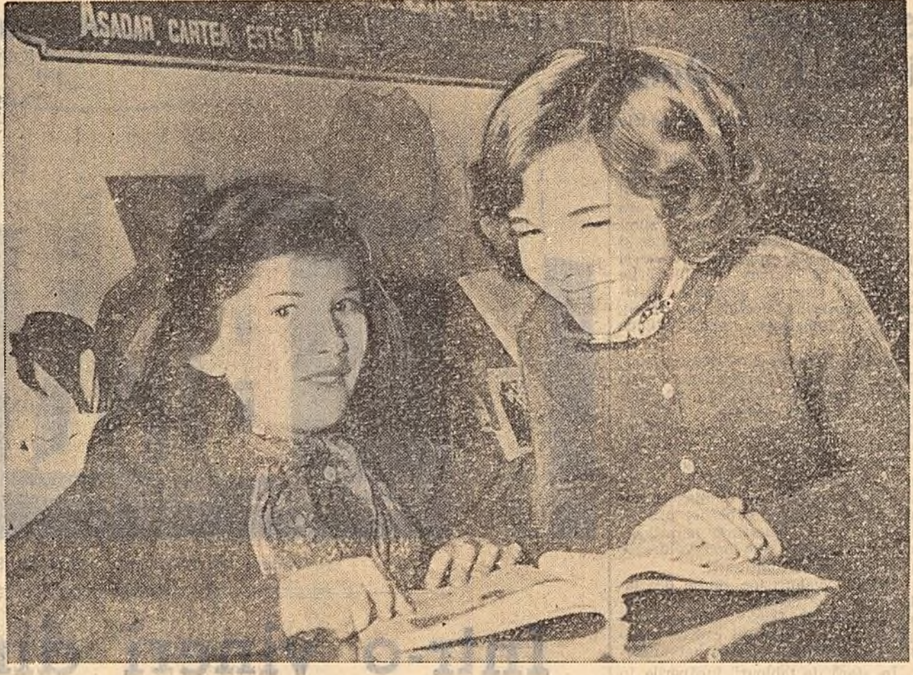
Secția pentru copii a bibliotecii regionale din Pitești este bine aprovizionată cu cărți și albume pentru micii cititori. Iată două vizitatoare ale secției de copii în fața unui album sosit de curînd în bibliotecă.

Intr-o zi miss Dietrich o întrebă în trecuț pe Nancy Lee ce mare crede că s-ar potrive mai bine tabloului ei. Asta îi trezise cele dinți bănuieii. Nu era un tablou modernist pe care trebuie să-l privești mult și bine ca să înțelegi ce vrea să arate. Era un tablou simplu, înfățișînd un colț al parcului orașului într-o zi de primăvară, cu pomii înălțîndu-se spre cer — încă fără frunze, cu lăcăr proaspăt și verde, cu un drapel fluturînd în virful unui stîlp înalt din centru și cu o bă-