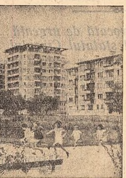
Unul din noile cartiere de locuințe din Sofia, construit în anii puterii populare.