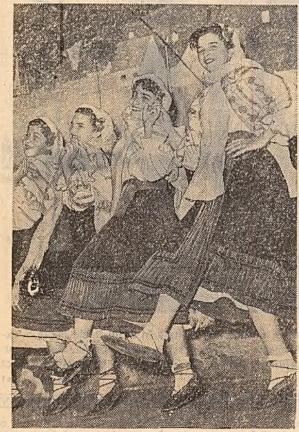
Ansamblul de cîntece și dansuri al casei de cultură din Sîlnia se bucură de succes în rîndurile omenilor muncii veniți ac la odihnă. Iată câteva din dansatoarele ansamblului.

Ajunși în sală, m-a cuprins și pe mine ceva din nerăbdarea și curiozitatea insolentului meu. Ne așezăm într-o sală frumoasă, încălzită, în care, pe lângă erau scaldată într-o ușoară înălbire, ca-n toate marile săli de spectacole. Luminile se revărsau plăcut din lanțuri de hirtie cretată, fixate sus. Tavanul, larg boltit, se lungea pînă-n fața