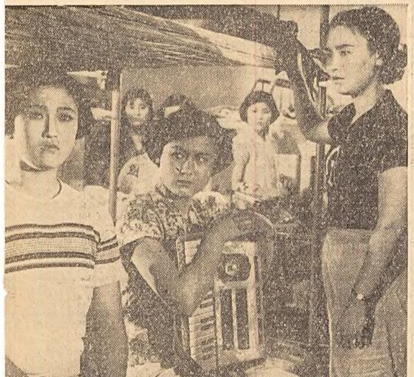
Fotografia de mai sus reprezintă o scenă din filmul „Jucătoarea de șah”, inspirați din viața sportivilor din R. P. Chineză...