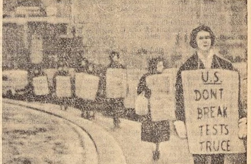
„S.U.A. - nu încălcați armistițiul experiențelor”. „Vrem lapte nu vorbe!” - cu astfel de lozinci au fost organizate pîchete în jurul ambasadei americane din Londra în semn de protest împotriva declarației făcute de guvernul american cu privire la încetarea moratoriului în problema experiențelor nucleare.

panții la demonstrație au prezentat reprezentanților autorităților o rezoluție în care cer să se revizuiască politica prețurilor la produsele agricole, ținîndu-se seama de pierderile producției lor, și a prețurilor la produsele industriale. Tărănii insistă de asemenea pentru anularea „impozitelor stabilite în mod samavolnic”.