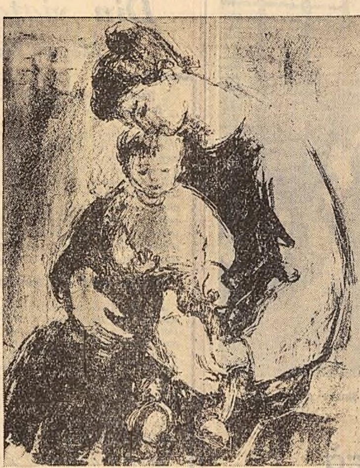
L. COSMESCU: Pace (stînga); G. NAUM: Rod bogat (dreapta) (Din Expoziția „Săptămîna gravurii” deschisă la Galeria „Magheru” ale Fondului Plastic).