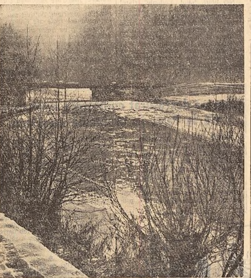
Bistrița văzută la Vatra Dornel.

● Teatrul de Operă și Balet al R. P. Romînie a prezentat vineri seara, într-o nouă montare, opera „Palatul de Leoncavallo”. Conducerea muzicală a aparținut dirijorului Jean Bobescu. Regia este semnată de Jean Rinzeanu, iar decorurile și costumele de Ion Ioser.