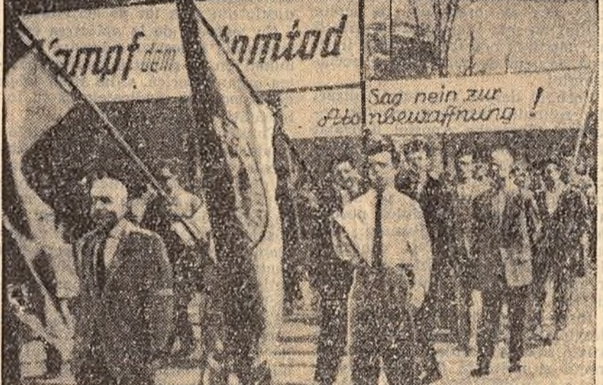
Düsseldorf. Manifestație a tinerilor germani împotriva înarmării atomice a R.F.G.