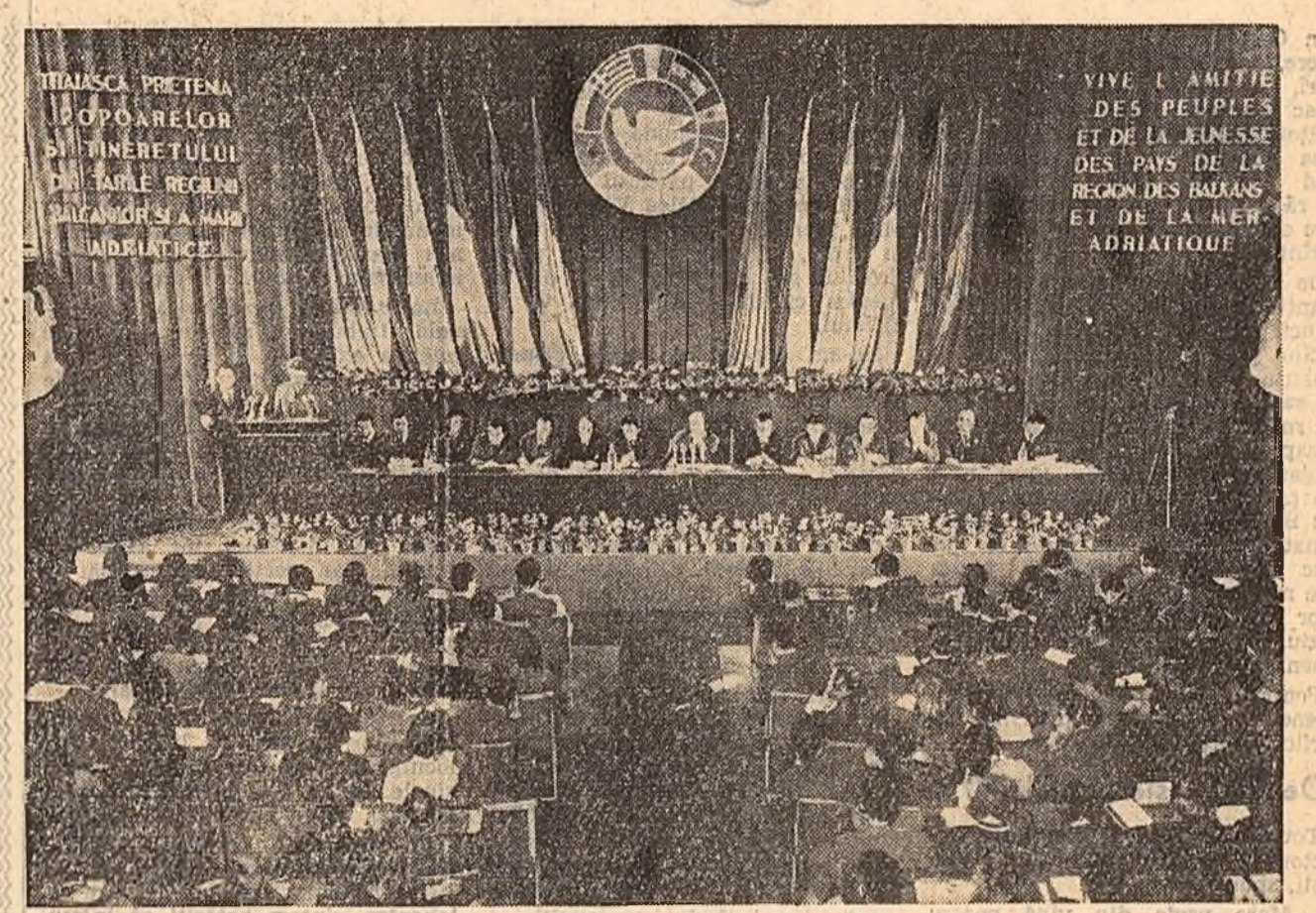
Aspect din timpul ședinței de deschidere.