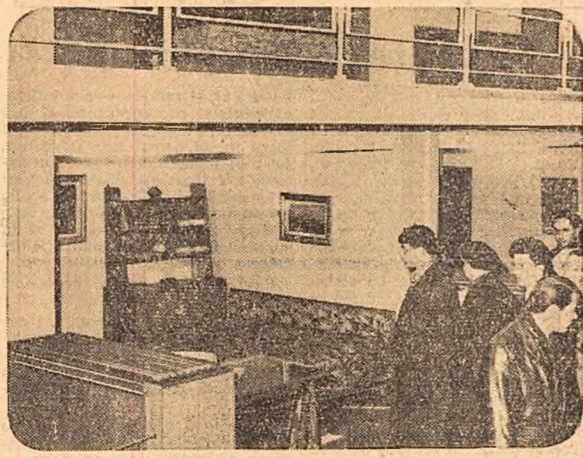
Aspect de la expoziția de mobilă