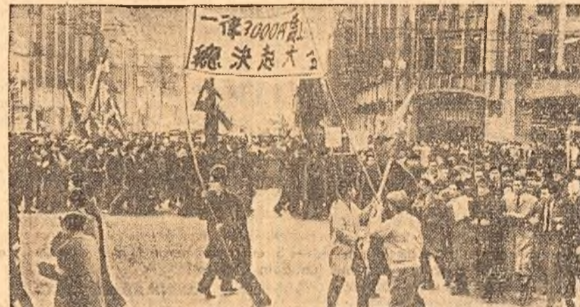
Aspect de la o mare demonstrație care a avut loc zilele trecute pe străzile orașului Tokio, capitala Japoniei. Demonstrații cer să se renunțe la ratificarea așa-numitului tratat de securitate japoano-american al cărui scop este remilitarizarea țării.