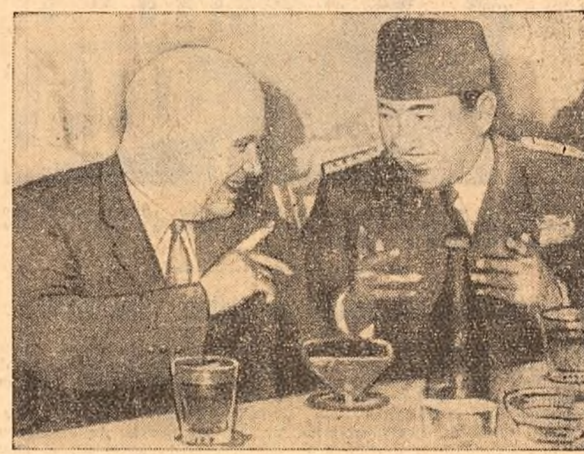
N. S. Hrușciov și președintele Republicii Indonezia, Sukarno, în palatul Merdeka.