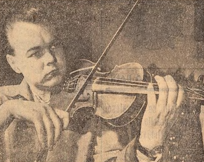
Aproape 600 de artiști amatori sînt elevi ai Școlii populare de artă din Oradea, care are 4 secții: de muzică, dans, teatru și artă plastică. Școala mai dispune de filiale la Beiuș și în orașul Petru Groza, pentru formarea de instructori ai formațiilor artistice de amatori din aceste localități.