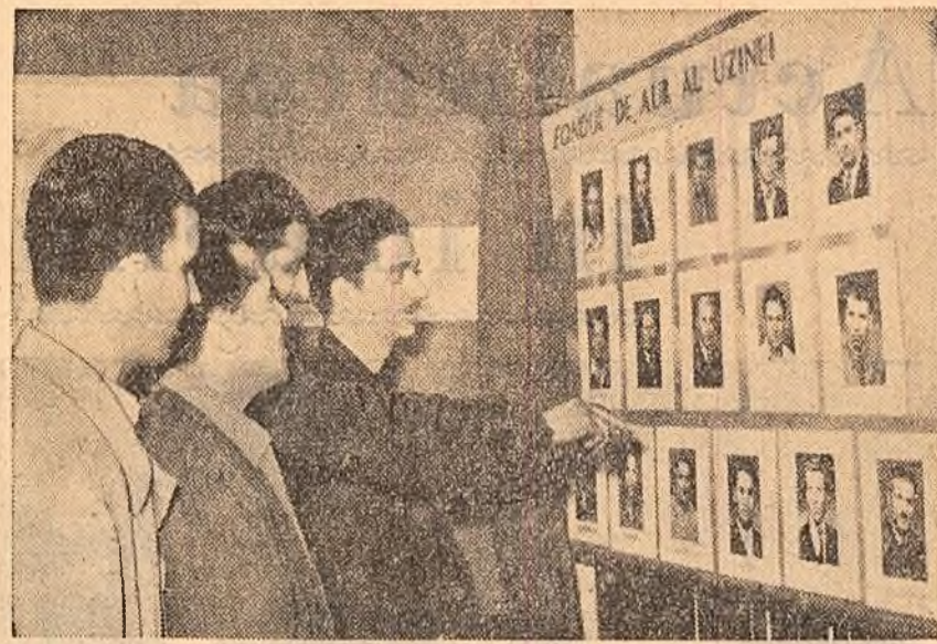
Panoul de onoare. Citiți muncitorii de la uzinele „Semănătoarea” din Capitală discută despre realizările obținute în întrecerea socialistă de către cei mai buni fruntași în producție.